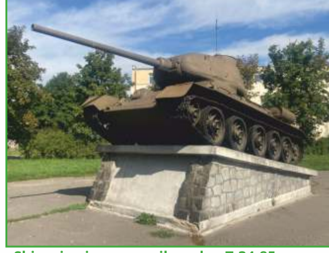
Skierniewice - pomnik czołgu T-34-85