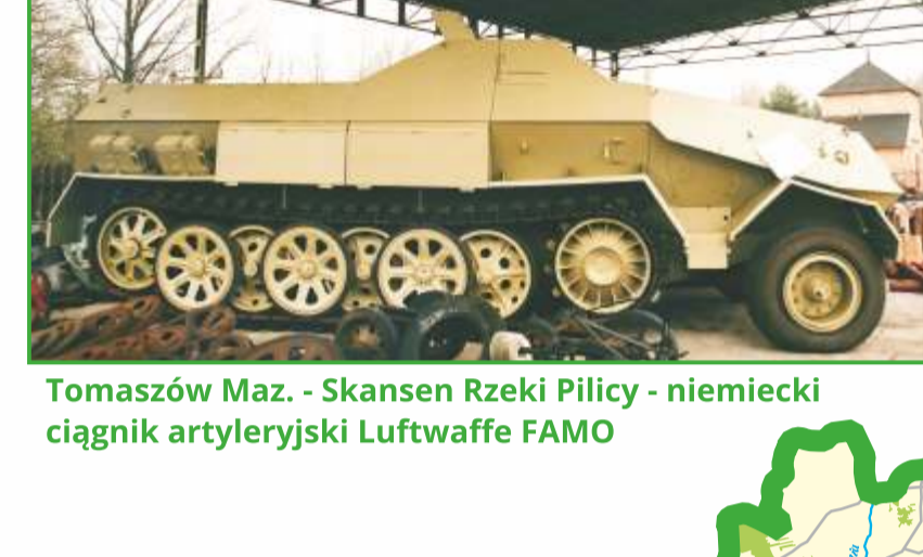
Tomaszów Maz. - Skansen Rzeki Pilicy - niemiecki ciągnik artyleryjski Luftwaffe FAMO