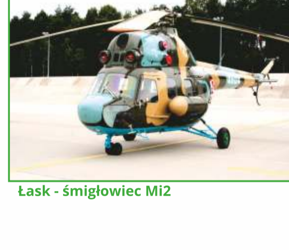
Łask - śmigłowiec Mi2