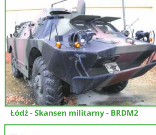
Łódź - Skansen militarny - BRDM2