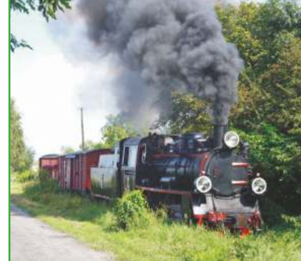
Krosniwicka kolej wąskotorowa