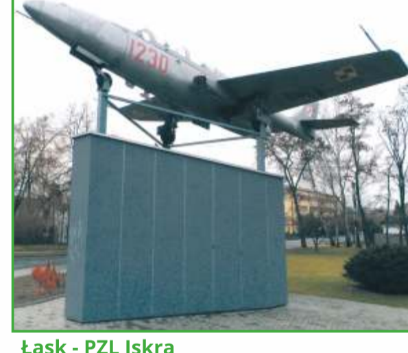
Łask - PZL Iskra