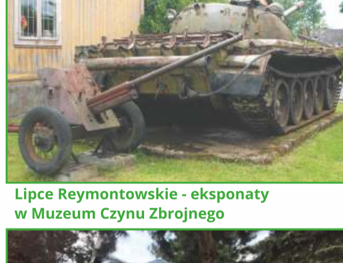
Lipce Reymontowskie - ekspozycje w Muzeum Czynu Zbrojnego