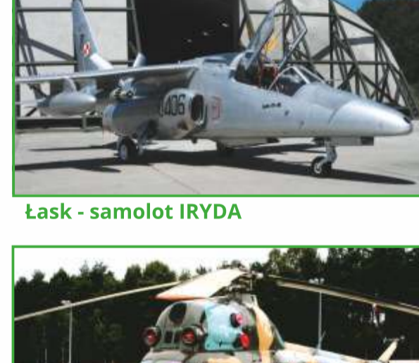
Łask - samolot IRYDA