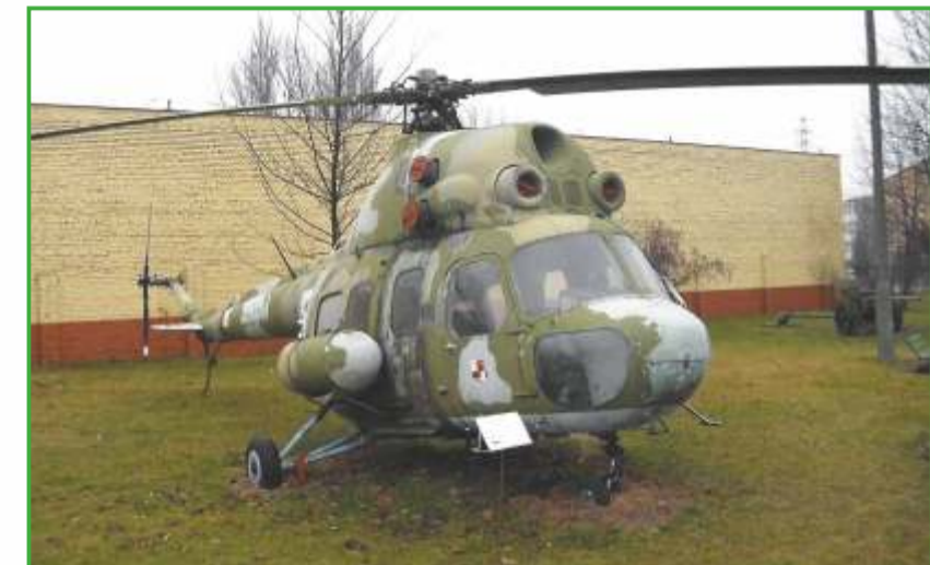
Łódź, ul. 6 Sierpnia - Skansen militarny; śmigłowiec Mi2