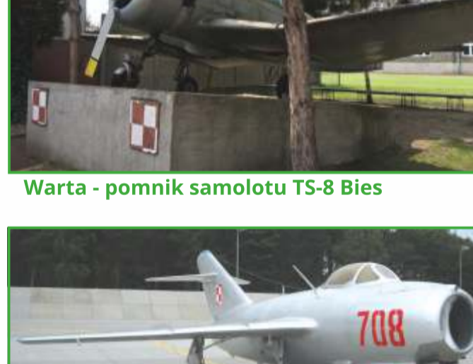
Warta - pomnik samolotu TS-8 Bies