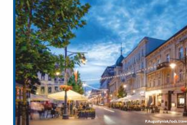
Łódź - ulica Piotrkowska