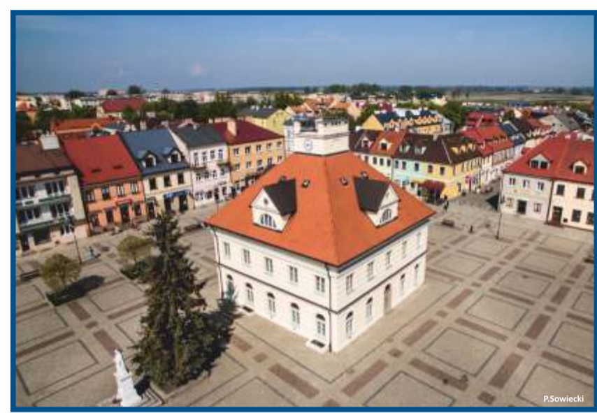
Łęczyca, ratusz - miejsce spotkań rowerzystów