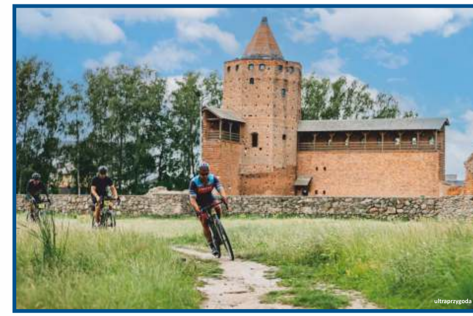
Rawa Mazowiecka, zamek - rajd rowerowy Galanta Pętla