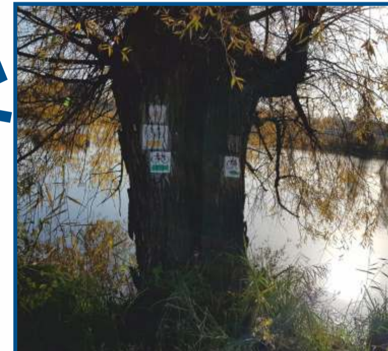
Oznakowanie szlaków turystycznych