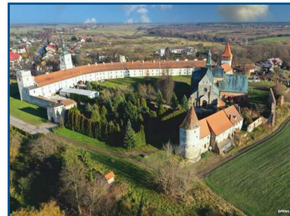
Sulejów - opactwo Cystersów na Szlaku Grunwaldzkim