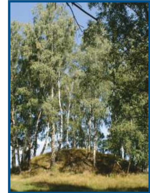
Przywóz - kurhany książęce na Szlaku Bursztynowym