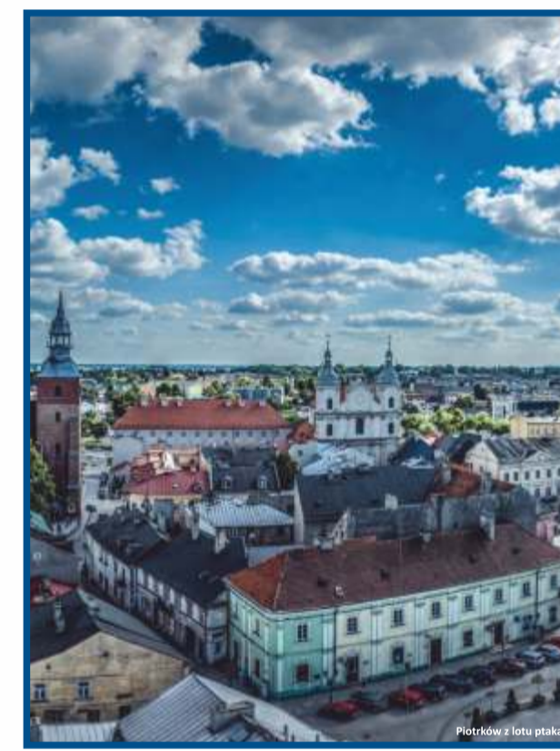
Piotrków Tryb. - Stare Miasto z lotu ptaka