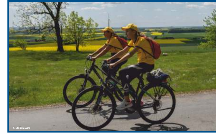
Okolice Bąkowej Góry - na szlaku rowerowym Nad Pilicą