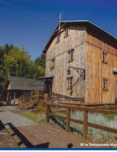
Tomaszów Maz. - Skansen Rzeki Pilicy