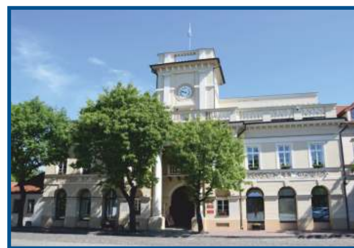
Łowicz, ratusz - początek łowickich szlaków turystycznych