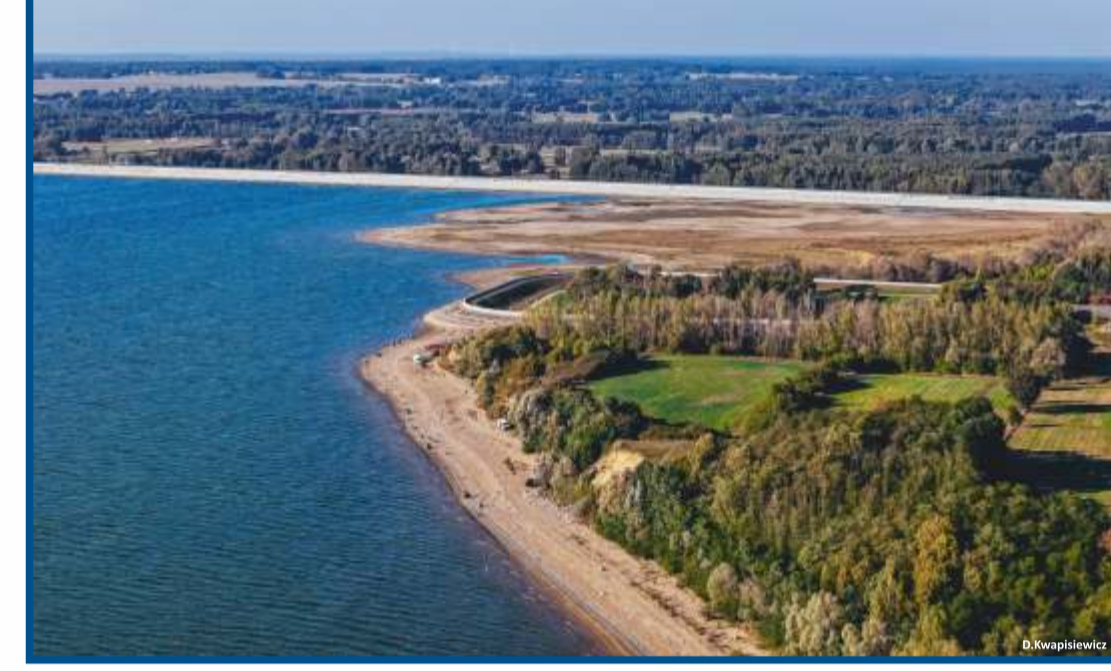
Siedlątków - tama na Zbiorniku Jeziorsko