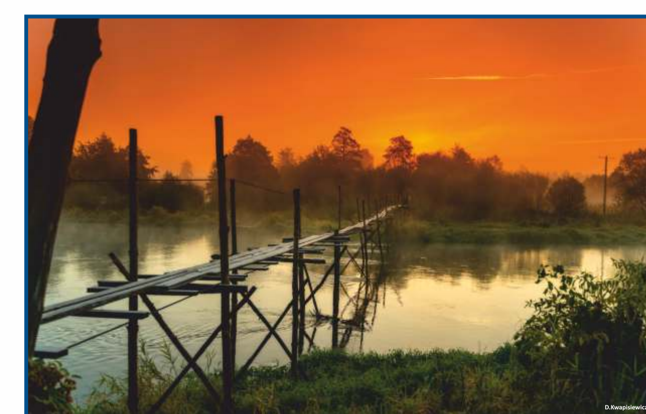
Trzy Mogi - „Małpi most” nad rzeką Pilicą