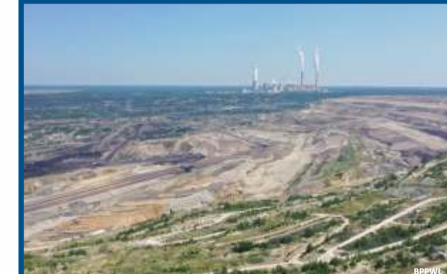
Żłobnica - punkt widokowy na odkrywkę Bełchatów