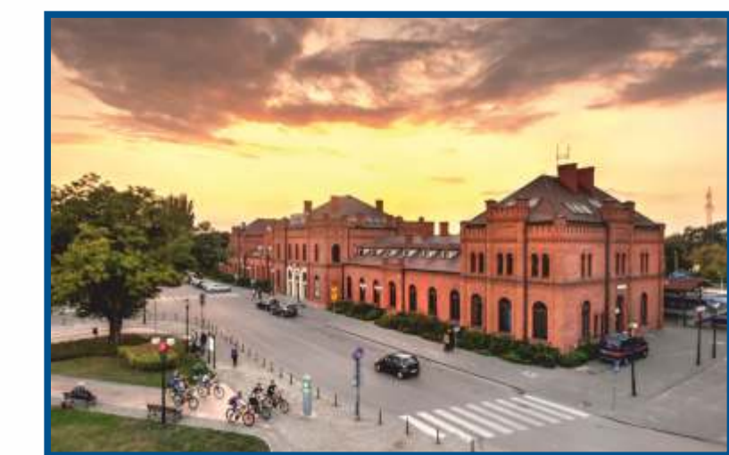
Skierniewice, dworzec kolejowy - węzeł szlaków rowerowych