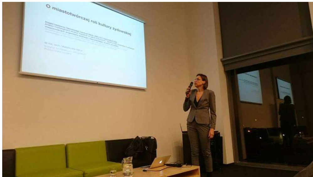
Spotkanie w Centrum Dialogu im. Marka Edelmana, luty 2018

Ponadto do oceny przedłożono cykl publikacji cząstkowych napisanych w latach 2012-2017, w formie artykułów, rozdziałów w książkach oraz publikacji pokonferencyjnych. Wszystkie przedstawione publikacje były przedmiotem recenzji oraz ich znakomita większość była poddana dyskusji na forum konferencji architektonicznych, urbanistycznych lub morfologii miasta.