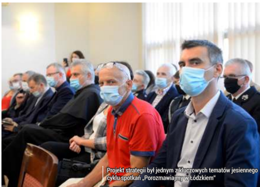
Projekt strategii był jednym z kluczowych tematów jesiennego cyklu spotkań „Porozmawiajmy w Łódzkiem”

Strategia rozwoju województwa jest dokumentem wyznaczającym kierunki rozwoju naszego regionu. W Łódzkiem konsultacje na ten temat trwały do 8 stycznia 2020 roku i cieszyły się zainteresowaniem. Uwagi można było zgłaszać drogą elektroniczną, pocztą tradycyjną lub ustnie. Zgłoszono prawie 300 wniosków i uwag. Spostrzeżenia do strategii wyraziło prawie 50 podmiotów. Wśród wnioskodawców dominowały samorządy gminne, ale swoimi pomysłami na rozwój województwa podzielił się także naukowcy, przedsiębiorcy, przedstawiciele powiatów, stowarzyszeń i fundacji, a nawet innych województw i urzędów centralnych. Urząd Marszałkowski Województwa Łódzkiego zorganizował sześć spotkań z pracownikami instytucji kultury, służby zdrowia i samorządowcami. Odbyły się one w Łodzi, Łowiczu i Sieradzu.