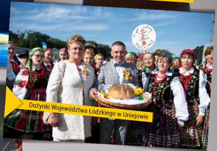
Dożynki Województwa Łódzkiego w Uniejowie