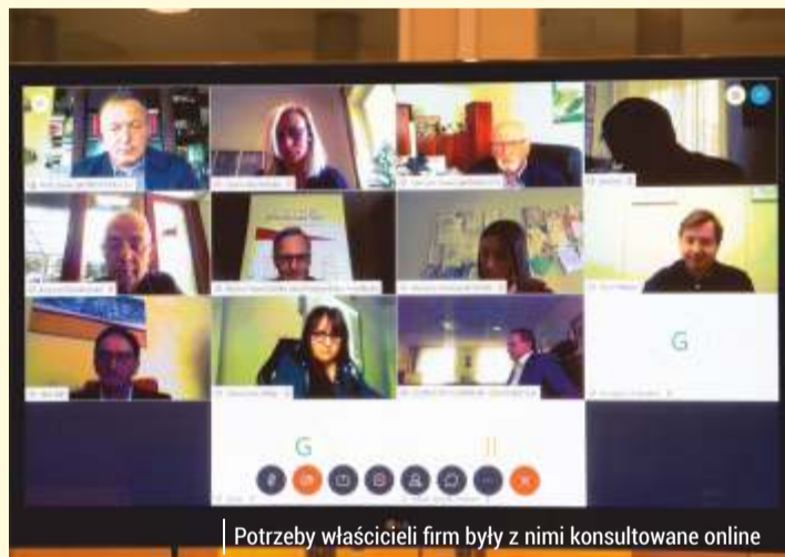
Potrzeby właścicieli firm były z nimi konsultowane online

To niebagatelne wsparcie przedsiębiorcy mogli wykorzystać