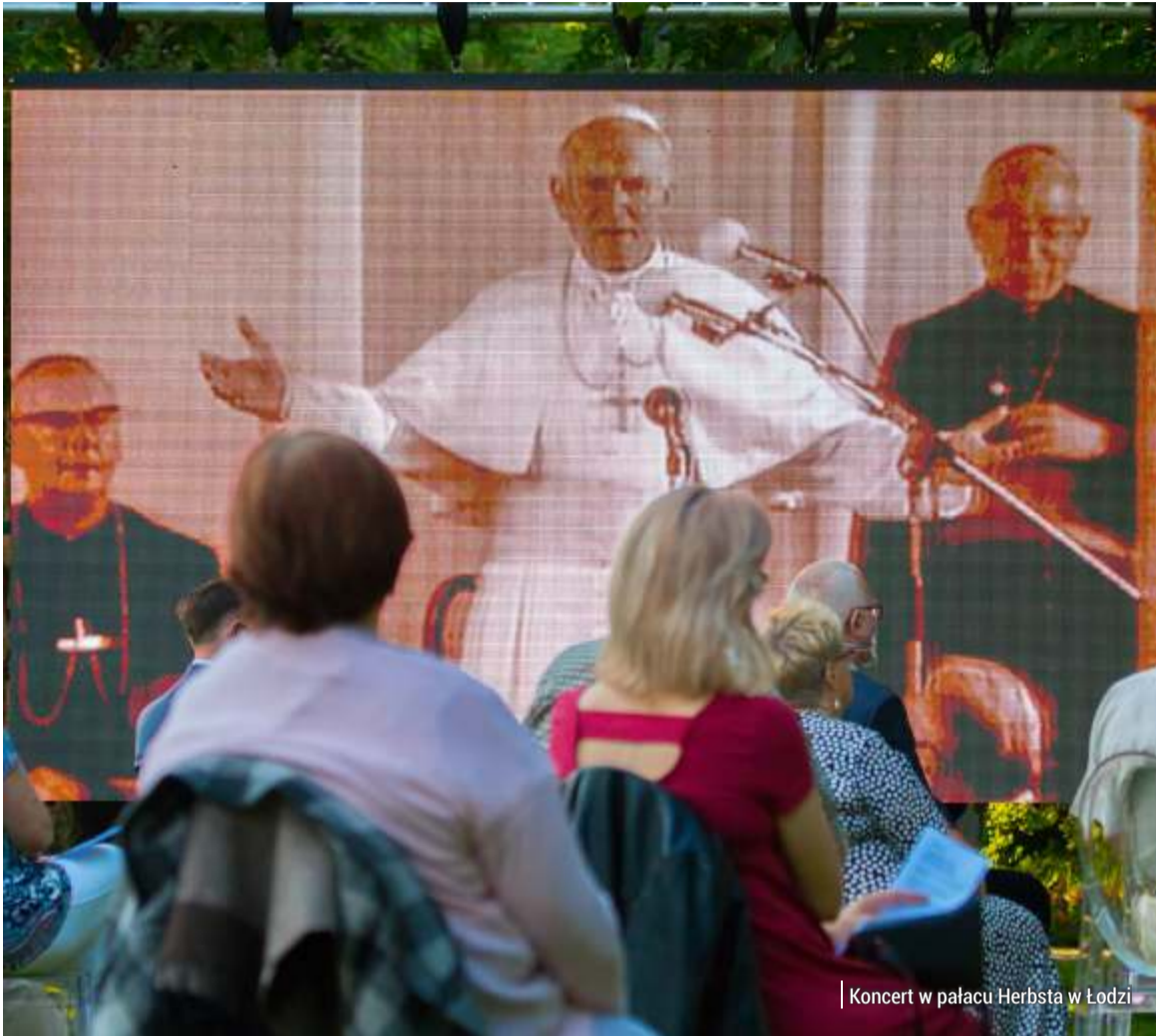
Koncert w pałacu Herbsta w Łodzi

Cztery wyjątkowe koncerty i sadzenie drzew – to wydarzenia organizowane podczas wojewódzkich obchodów Roku Świętego Jana Pawła II, ustanowionego przez Sejm.