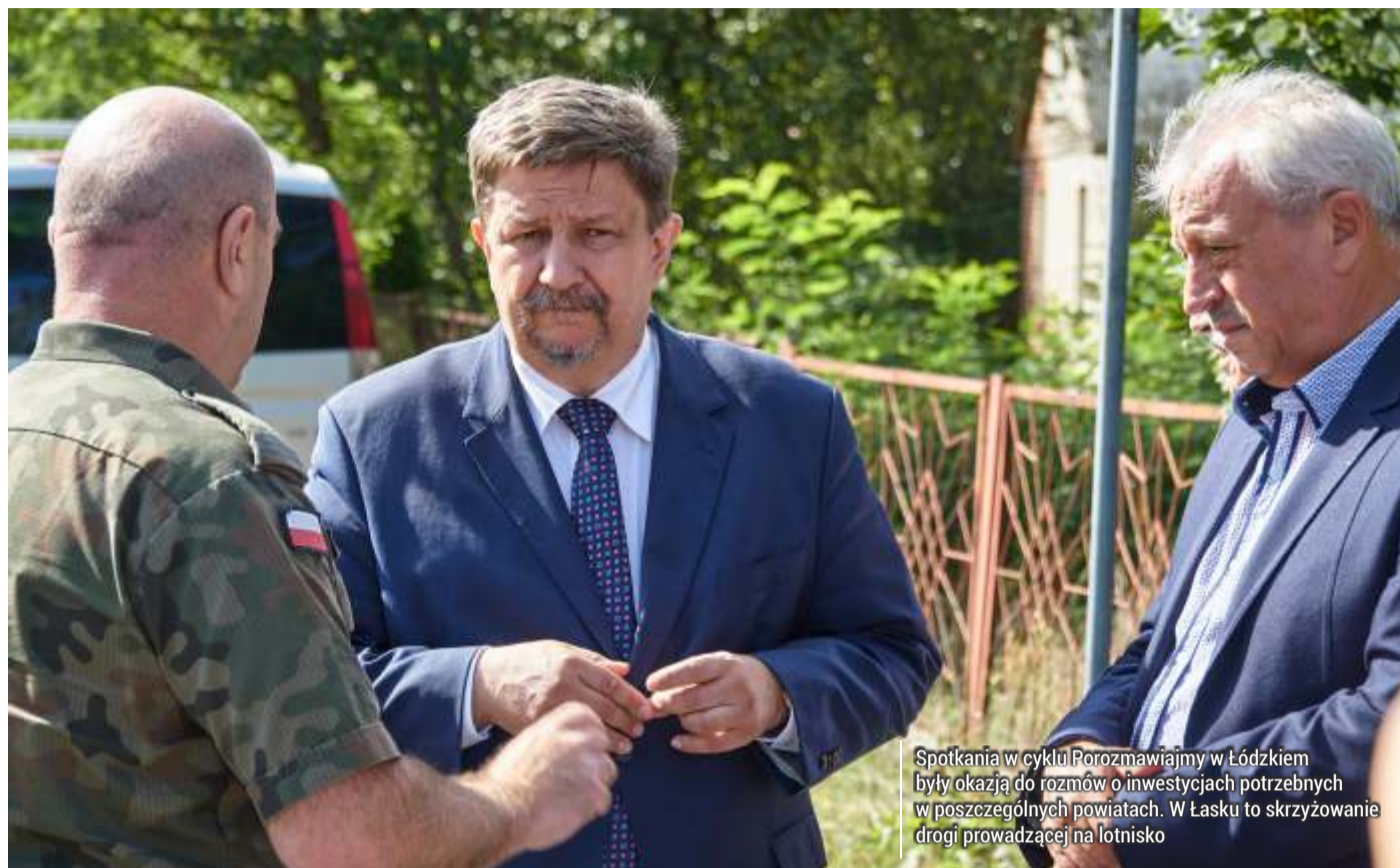
Spotkania w cyklu Porozmawiajmy w Łódzkiem były okazją do rozmów o inwestycjach potrzebnych w poszczególnych powiatach. W Łasku to skrzyżowanie drogi prowadzącej na lotnisko