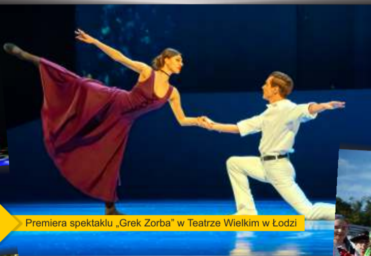
Premiera spektaklu „Grek Zorba” w Teatrze Wielkim w Łodzi