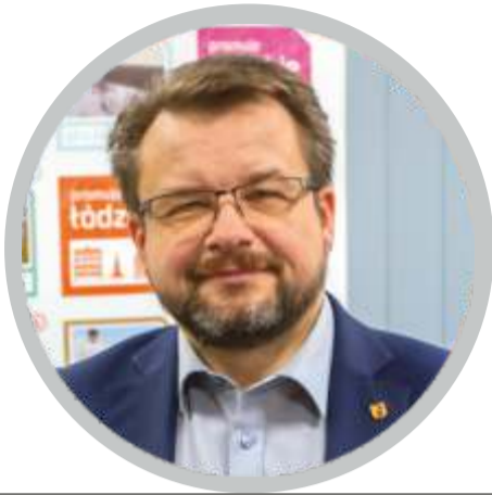
Piotr Adamczyk wicemarszałek województwa łódzkiego

- Rok 2020 to przede wszystkim czas pandemii, który w znacznej mierze zmienił funkcjonowanie samorządu województwa. Dlatego dla mnie ten rok był okresem wyzwań, ale też sukcesów. A za taki uważam stworzenie dwóch autorskich programów województwa łódzkiego