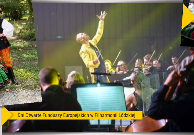
Dni Otwarte Funduszy Europejskich w Filharmonii Łódzkiej