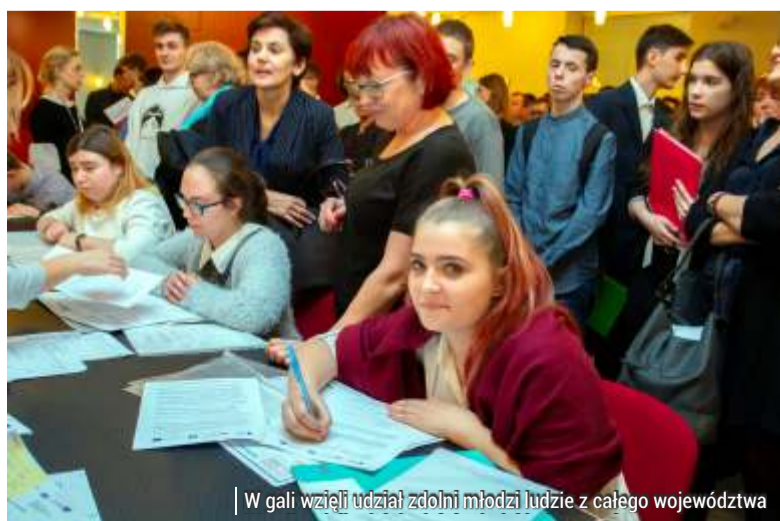
W gali wzięli udział zdolni młodzi ludzie z całego województwa