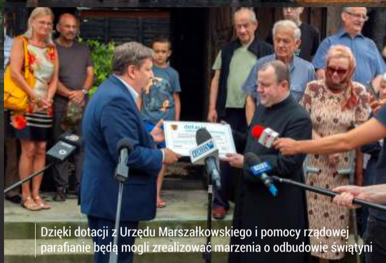
Dzięki dotacji z Urzędu Marszałkowskiego i pomocy rządowej parafianie będą mogli zrealizować marzenia o odbudowie świątyni