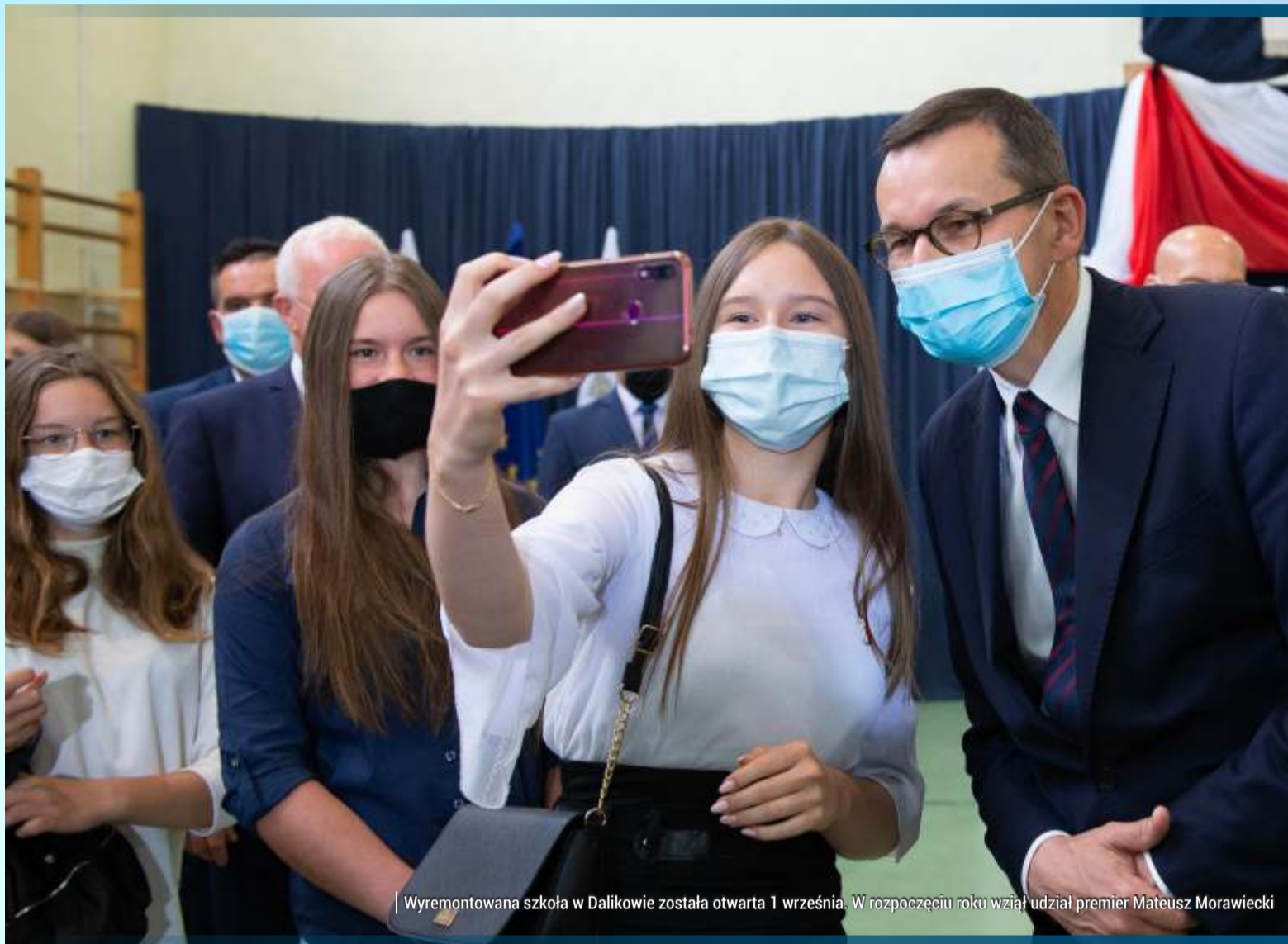
Wyremontowana szkoła w Dalikowie została otwarta 1 września. W rozpoczęciu roku wziął udział premier Mateusz Morawiecki

Wszystko się zmieniło po rozbudowie szkoły, na którą gmina pozyskała prawie 3 mln zł z Regionalnego Programu Operacyjnego Województwa Łódzkiego na lata 2014-2020 i ponad 800 tys. z rządowego programu „Sportowa Polska”. Dzięki temu w 2020 roku powstała nowoczesna sala sportowa z zapleczem oraz pracownice: mate-