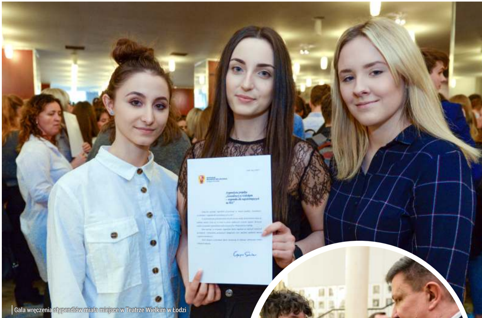
Gala wręczenia stypendiów miała miejsce w Teatrze Wielkim w Łodzi

przychodzi samo – mówi. – Pracowałam na nie cały rok. Projektowałam, brałam udział w konkursach. Ubiorem interesowałam się już jako mała dziewczynka. Lubiłam oglądać gwiazdy w nieziemskich sukien-