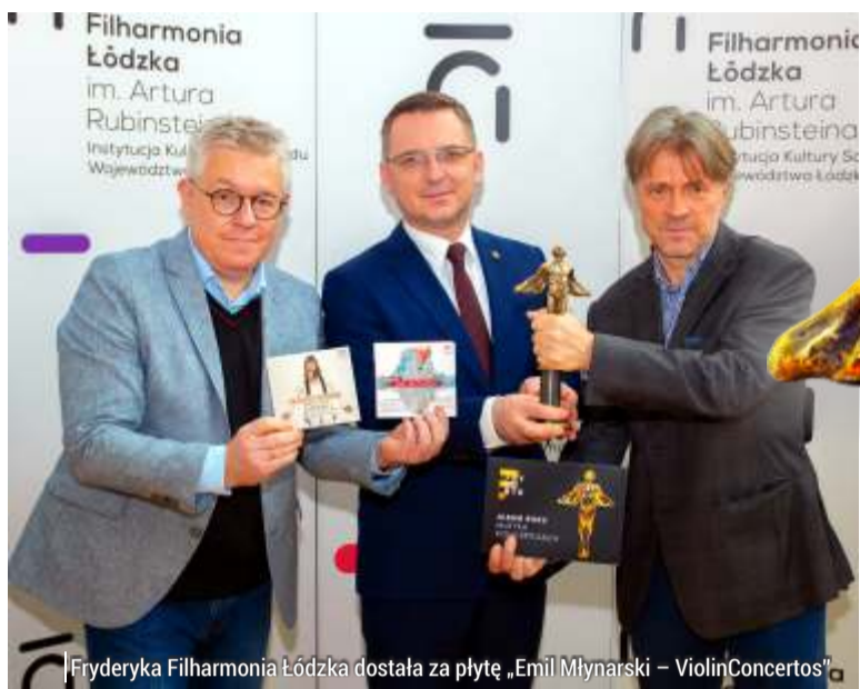
Fryderyka Filharmonia Łódzka dostała za płytę „Emil Młynarski – ViolinConcertos”