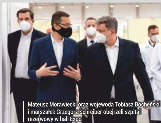
Mateusz Morawiecki oraz wojewoda Tobiasz Bocheński i marszałek Grzegorz Schreiber obejrzały szpital rezerwy w hali Expo

utworzony po powołaniu tego typu lecznicy na Stadionie Narodowym w Warszawie. Szpital został skonstruowany w taki sposób, aby nie tylko sprzęt medyczny, ale też infrastruktura mogły zostać wykorzystane w innych szpitalach wojewódzkich, gdy nie będzie zagrożenia epidemicznego.