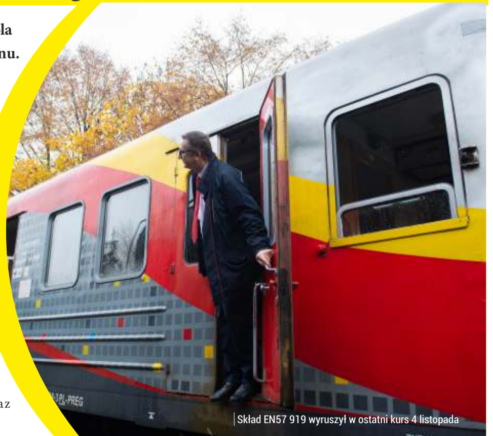
Skład EN57 919 wyruszył w ostatni kurs 4 listopada

Urzędu Marszałkowskiego, podarowany przez samorząd województwa pociąg będzie służył nie tylko jako eksponat muzealny, atrakcja dla pasjonatów historii techniki i kolejnictwa w naszym regionie. Będzie także wykorzystywany do promocji przewozów pasażerskich i transportu zbiorowego, organizowanego przez marszałka województwa i organizacji wydarzeń kulturalnych oraz edukacyjnych.