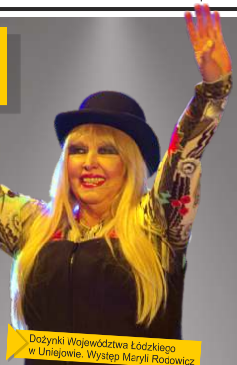
Dożynki Województwa Łódzkiego w Uniejowie. Występ Maryli Rodowicz