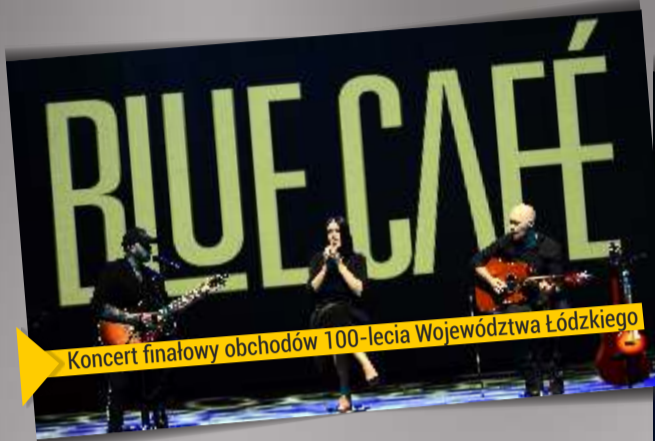
Koncert finałowy obchodów 100-lecia Województwa Łódzkiego

Nielatwo było nam świętować w 2020 roku. Jednak kilka imprez udało się zorganizować. Z zachowaniem ostrożności i zasad bezpieczeństwa. Tym bardziej będziemy wspominać imprezy, podczas których mogliśmy choć na chwilę zapomnieć o epidemicznej rzeczywistości.