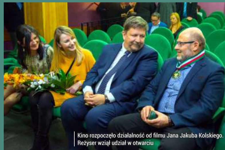
Kino rozpoczęło działalność od filmu Jana Jakuba Kolskiego. Reżyser wziął udział w otwarciu

To było jedno z istotnych wydarzeń kulturalnych początku 2020 roku. Uroczyste, przy udziale znanego reżysera Jana Jakuba Kolskiego, zaczęło działać w Łódzkim Domu Kultury kino „Perspektywa”.