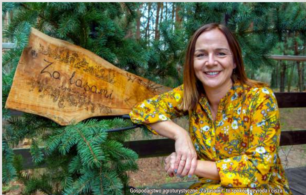
Gospodarstwo agroturystyczne „Za lasami” to spokój, przyroda i cisza