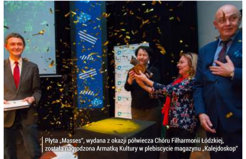
Płyta „Masses”, wydana z okazji półwiecza Chóru Filharmonii Łódzkiej, została nagrodzona Armatką Kultury w plebiscycie magazynu „Kalejdoskop”