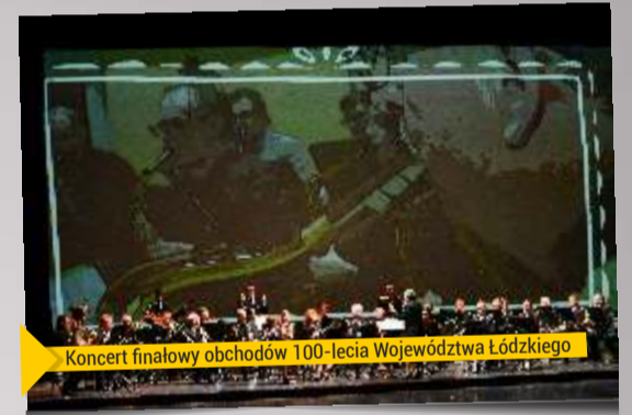
Koncert finałowy obchodów 100-lecia Województwa Łódzkiego