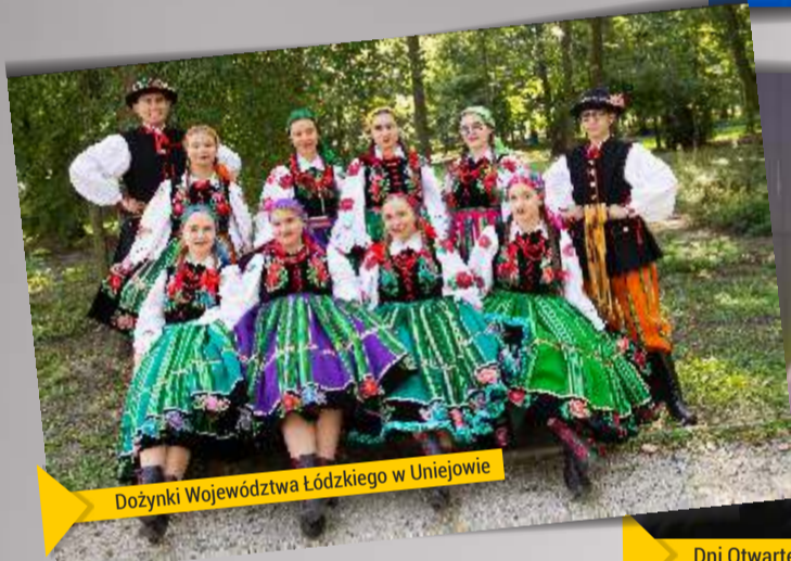
Dożynki Województwa Łódzkiego w Uniejowie