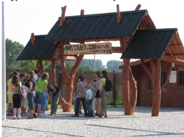
Zdjęcie 1 i 2. Zoo Safari w Borysewie