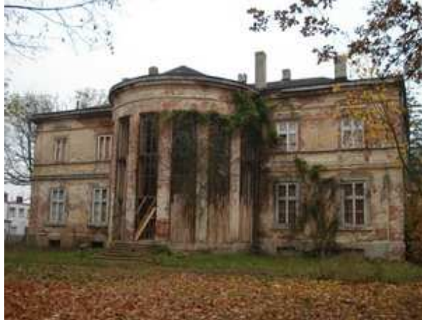
Zdjęcie 3 i 4. Pałac w Zadzimiu (od lewej) oraz Pałac w Poddębicach (od prawej)