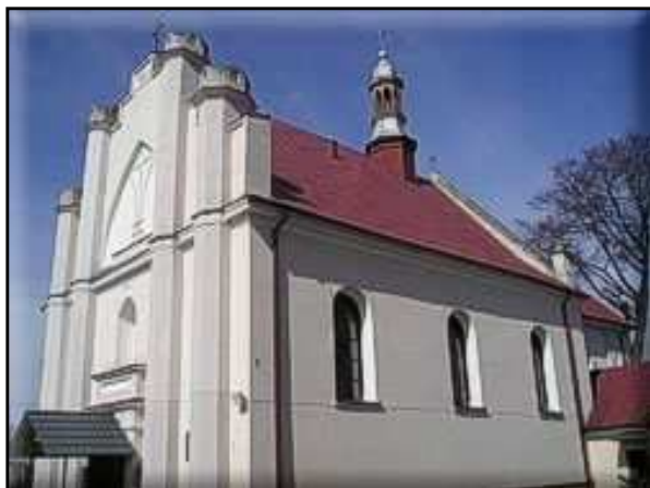
Zdjęcie 5 i 6. Kościół pod wezwaniem św. Idziego w Bałdrzychowie (od lewej) oraz Kościół pod wezwaniem św. Mikołaja, Biskupa w Kałowie (od prawej)