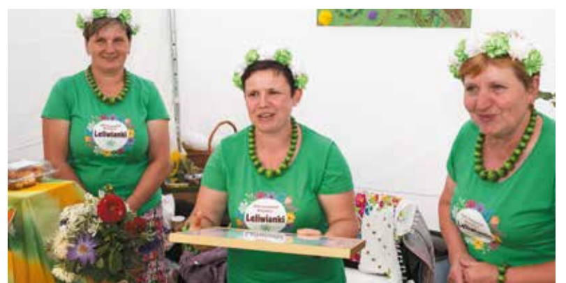
Panie z KGW Leliwianki, powiat sieradzki