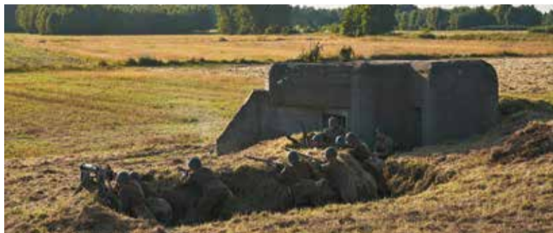
Polscy żołnierze broniący umocnień, które stanowiły strategiczny cel dla Niemców w tej bitwie. W Beleniu zachował się jeden z oryginalnych bunkrów

W Łowiczu dzięki projektowi „Łódzkie Pamięta” mieszkańcy regionu przenieśli się w czasie do 9 września 1939, kiedy toczyła się bitwa o miasto. W inscenizacji wzięło udział 140 rekonstruktorów z 13 grup rekonstrukcyjnych oraz kilkudziesięciu uczniów łowickich szkół grających ludność cywilną. Widzowie mieli okazję zobaczyć kilkanaście pojazdów wojskowych z epoki oraz imponujące, ale też budzące trwogę pokazy pirotechniczne.