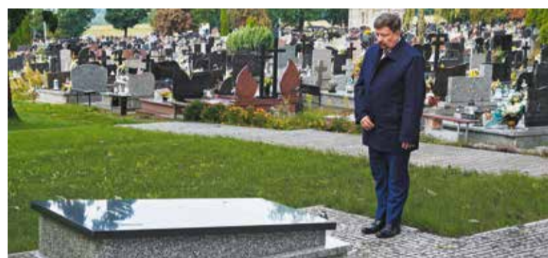
W Strońsku w gminie Zapolice marszałek Grzegorz Schreiber zapalił znicze na mogiłach żołnierzy poległych w walkach 1939 roku