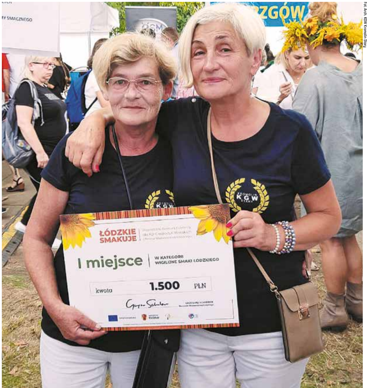
Podczas dożynek wojewódzkich panie z Koła Gospodyń Wiejskich Kromolin Stary zdobyły pierwszą nagrodę za wigilijną kaszę z sosem grzybowym