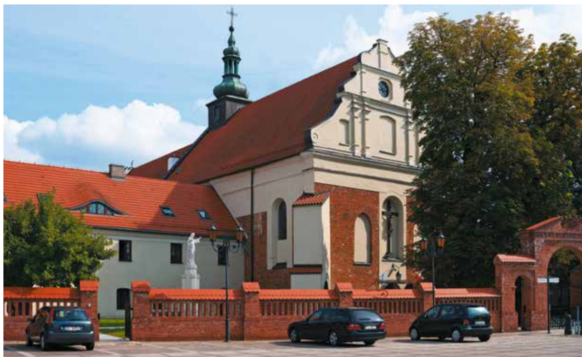
W sieradzkim kościele św. Stanisława Biskupa Męczennika odnowiony zostanie ołtarz pw. Wizji św. Antoniego

O generalnym remoncie sieradzkiego zespołu klasztornego zakonnice ze Zgromadzenia Sióstr Urszulanek w Sieradzu myślały od dawna. Największą przeszkodą był jednak brak pieniędzy. Dzięki dotacjom, między innymi od samorządu województwa, klasztor pięknieje.