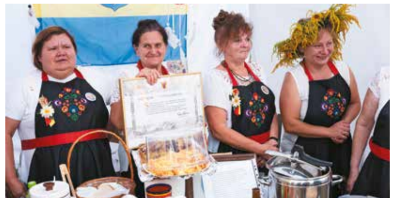
Gratulacje za udział w dożynkach i przygotowanie pyszności dla KGW Wilmów z powiatu poddębickiego