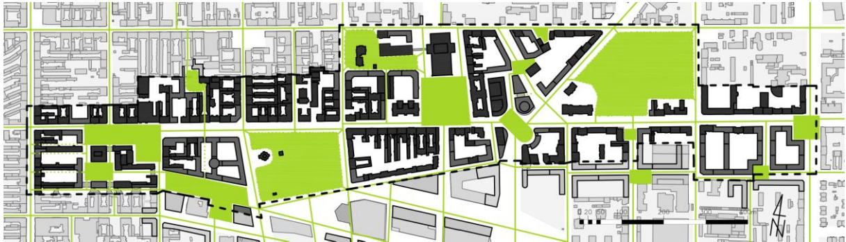
Rys. 4. Schemat projektowanego systemu przestrzeni publicznych.

podejmuje problemy transportu publicznego , adaptacji do zmian klimatu i ochrony dziedzictwa kulturowego . Szczegółem koncepcji było zagospodarowanie skrzyżowania ulicy Narutowicza z ulicą Tramwajową wraz z projektem narożnego, mieszkalnego budynku wielorodzinnego, uzupełniającego tkankę miejską.