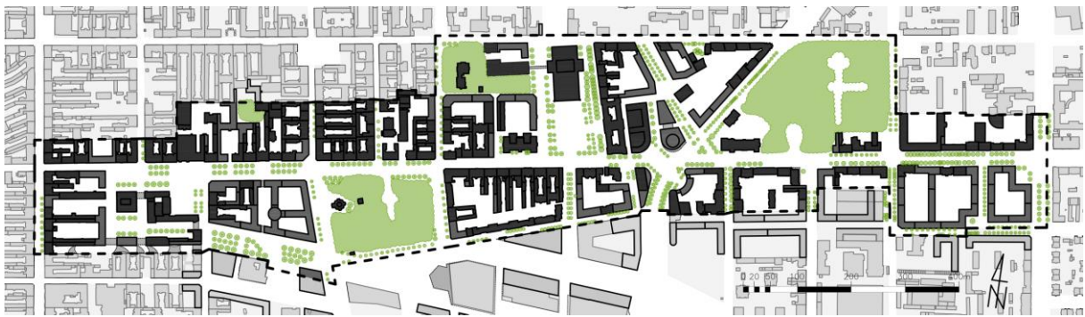
Rys. 2. Schemat projektowanej i istniejącej zieleni wysokiej na terenach publicznych.

Tworzy to jednak charakterystyczny układ przestrzenny, który pod względem kompozycyjnym ma ogromny potencjał. Częściowo jest on już na trwałe zmarnowany, natomiast większość terenu otwiera się na odważne pomysły. Najważniejsze jednak, żeby w tak ważnym, historycznym środowisku były to koncepcje odpowiedzialne i celne, szacujące współczesne wyzwania zrównoważonego rozwoju .