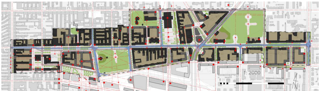
Rys. 1. Rysunek główny projektu - koncepcja urbanistyczna.

Ulica Narutowicza to jedna z najważniejszych przestrzeni w Łodzi. Nie tylko ze względu na swoją przeszłość, której większość pamiątek, w postaci, pięknej reprezentacyjnej i monumentalnej architektury czynszowych kamienic i gmachów użyteczności publicznej, możemy do dzisiaj odnaleźć. Obecnie jest to przestrzeń łącząca dwa ważne obszary w śródmieściu, które przechodzą lub będą przechodzić zasadnicze przeobrażenia. Ulica Narutowicza jak w soczewce skupia historię rozwoju Łodzi. Ze wszystkimi tego zaletami i wadami.