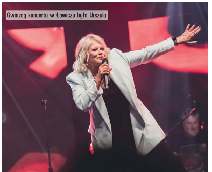
Gwiazdą koncertu w Łowiczu była Urszula