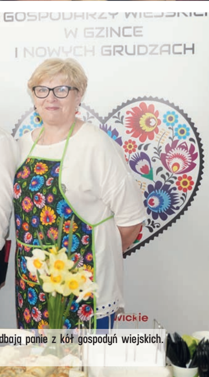
... dbają panie z kół gospodyń wiejskich.