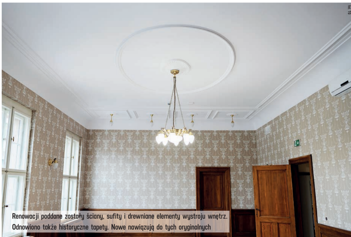
Renowacji poddane zostały ściany, sufity i drewniane elementy wystroju wnętrz. Odnowiono także historyczne tapety. Nowe nawiązują do tych oryginalnych