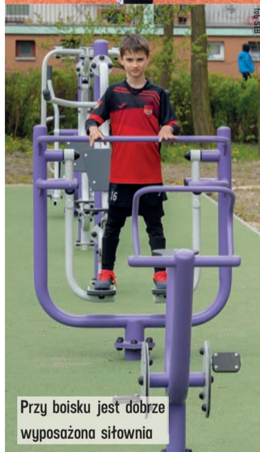
Przy boisku jest dobrze wyposażona siłownia