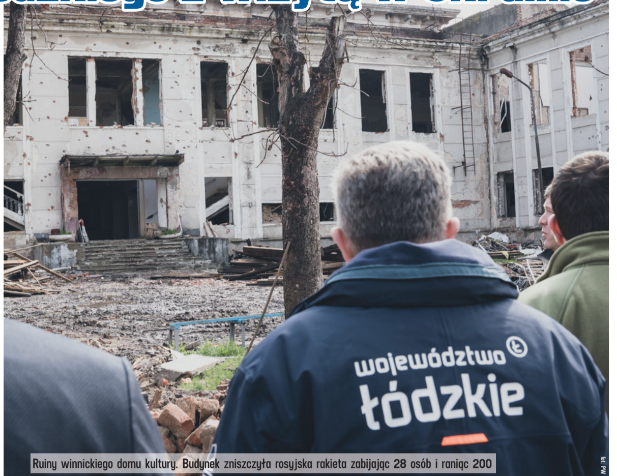
Ruiny winnickiego domu kultury. Budynek zniszczyła rosyjska rakietą zabijając 28 osób i raniąc 200