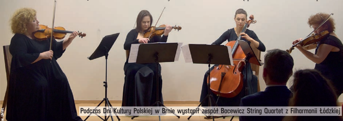
Podczas Dni Kultury Polskiej w Brnie wystąpił zespół Bacewicz String Quartet z Filharmonii Łódzkiej