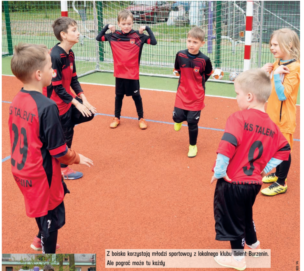
Z boiska korzystają młodzi sportowcy z lokalnego klubu Talent Burzenin. Ale pograć może tu każdy