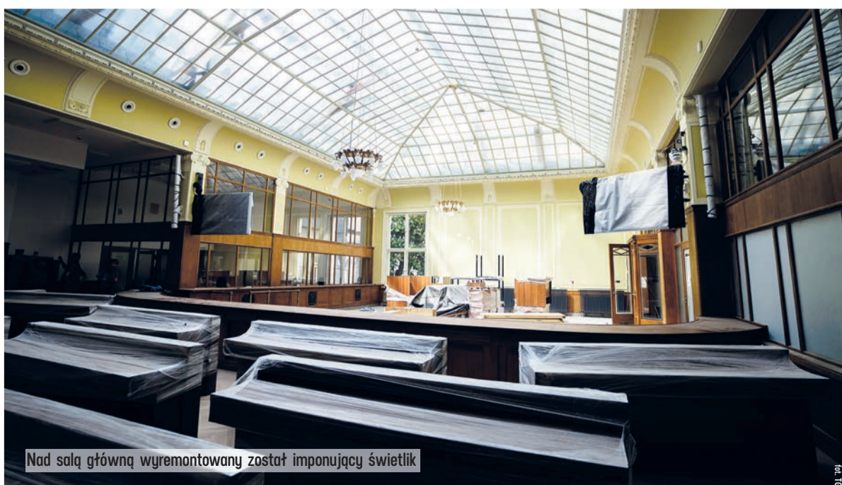
Nad salą główną wyremontowany został imponujący świetlik