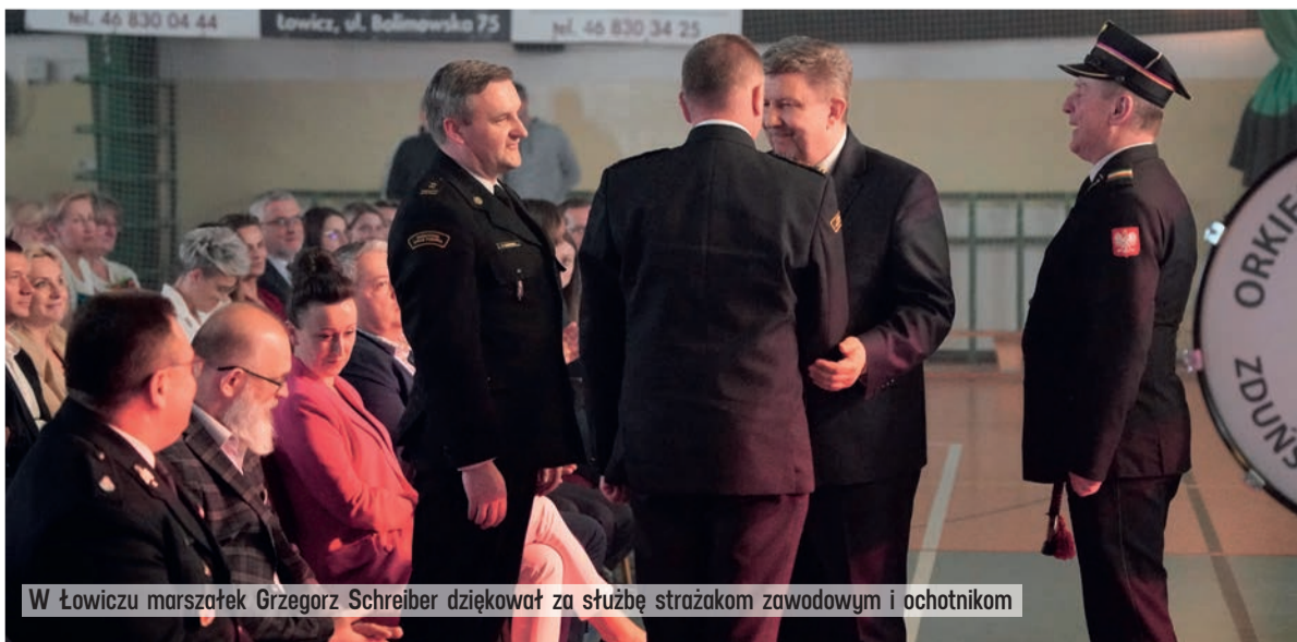
W Łowiczu marszałek Grzegorz Schreiber dziękował za służbę strażakom zawodowym i ochotnikom