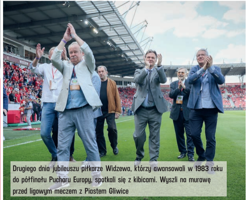
Drugiego dnia jubileuszu piłkarze Widzewa, którzy awansowali w 1983 roku do półfinału Pucharu Europy, spotkali się z kibicami. Wyszli na murawę przed ligowym meczem z Piastem Gliwice