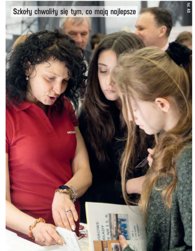
Szkoły chwaliły się tym, co mają najlepsze