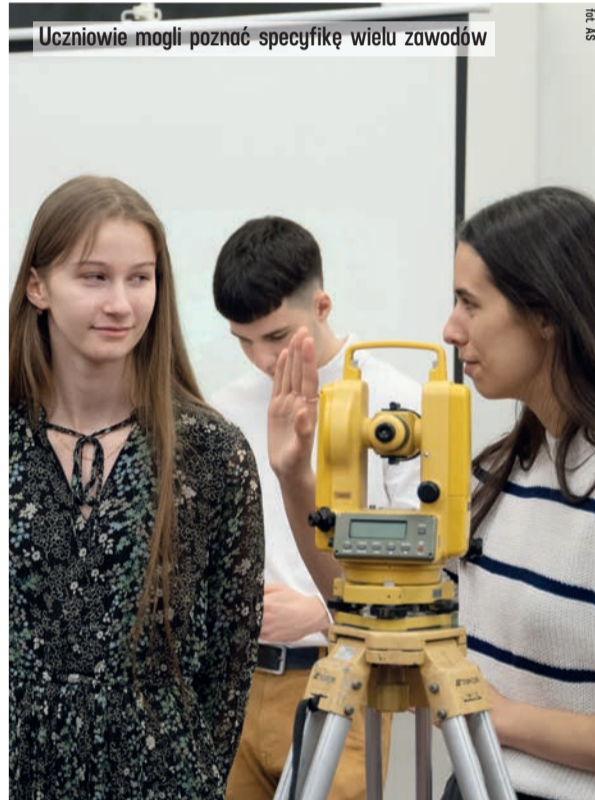
Uczniowie mogli poznać specyfikę wielu zawodów