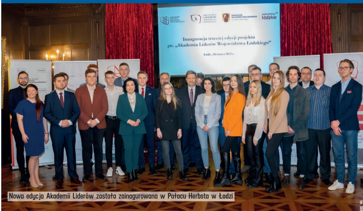
Nowa edycja Akademii Liderów została zainaugurowana w Pałacu Herbsta w Łodzi

Prawie 30 nowych słuchaczy rozpoczęło naukę w Akademii Liderów Województwa Łódzkiego, czyli projekcie realizowanym przez Narodowy Instytut Samorządu Terytorialnego we współpracy z Urzędem Marszałkowskim. 10 marca zainaugurowana została trzecia edycja szkoleń dla ambitnych, kreatywnych młodych mieszkańców naszego województwa.