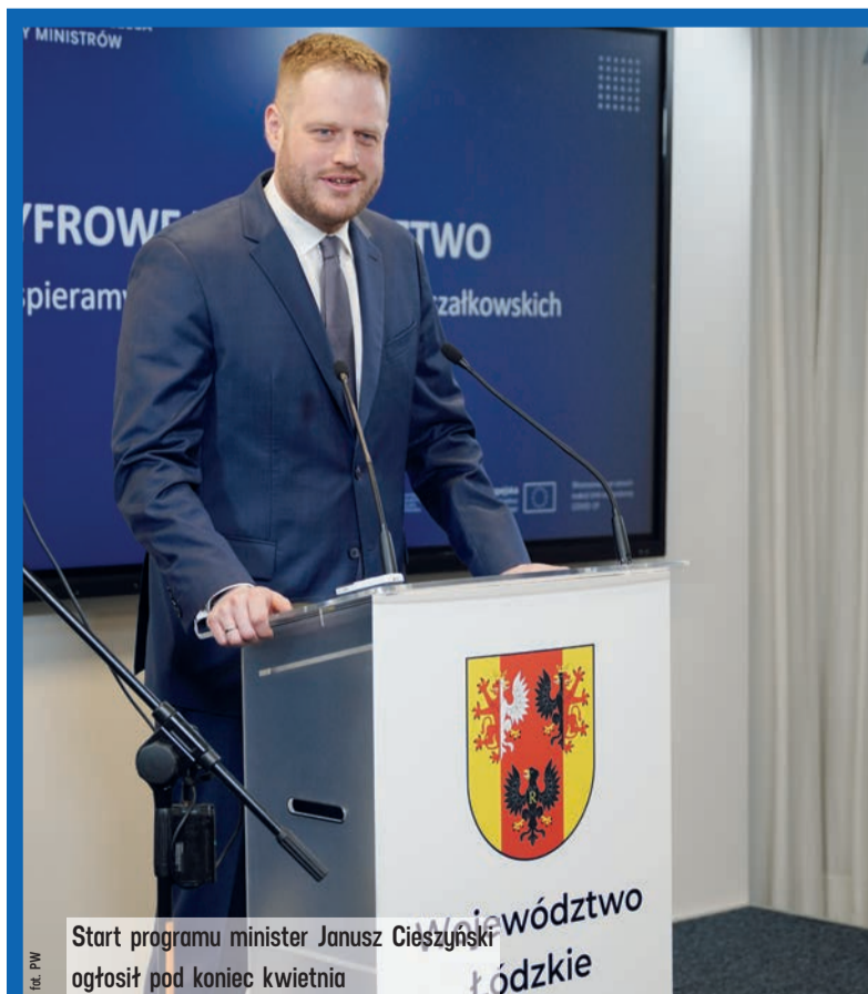
Start programu minister Janusz Cieszyński ogłosił pod koniec kwietnia

Janusz Cieszyński, minister cyfryzacji, ogłosił w Urzędzie Marszałkowskim WŁ start programu, którego celem jest wsparcie cyfrowego rozwoju samorządów wojewódzkich oraz zwiększenie cyberbezpieczeństwa.