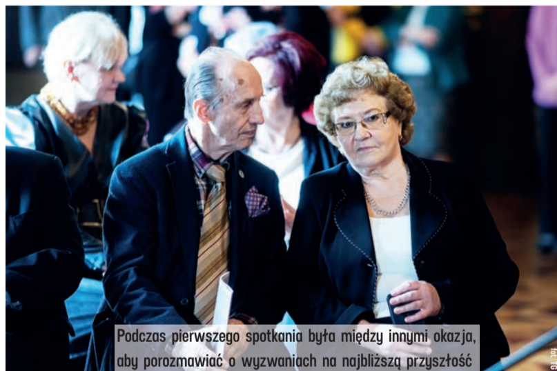
Podczas pierwszego spotkania była między innymi okazja, aby porozmawiać o wyzwaniach na najbliższą przyszłość

Obywatelski Parlament Seniorów to ogólnopolskie przedstawicielstwo osób starszych, pełniące funkcję rzecznika interesów ok. 9-milionowej grupy osób 60+. OPS działa w Polsce od 2015 roku. W 2022 roku rozpoczęła się czwarta kadencja parlamentu (każda trwa 3 lata). Łącznie w OPS, tak jak w Sejmie, zasiada 460 osób.