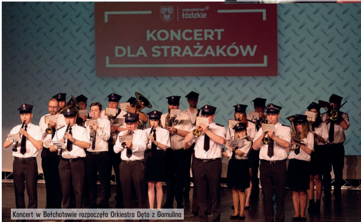
Koncert w Bełchatowie rozpoczęła Orkiestra Dęta z Gomułina