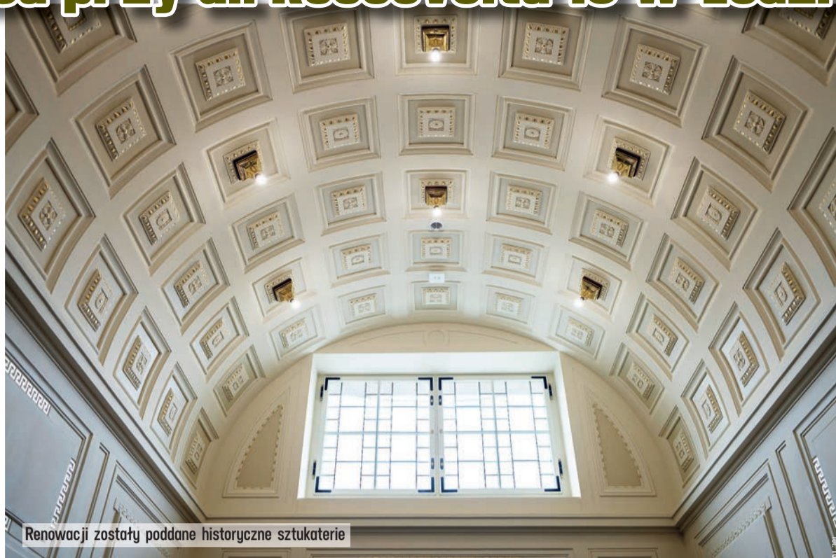
Renowacji zostały poddane historyczne sztukaterie