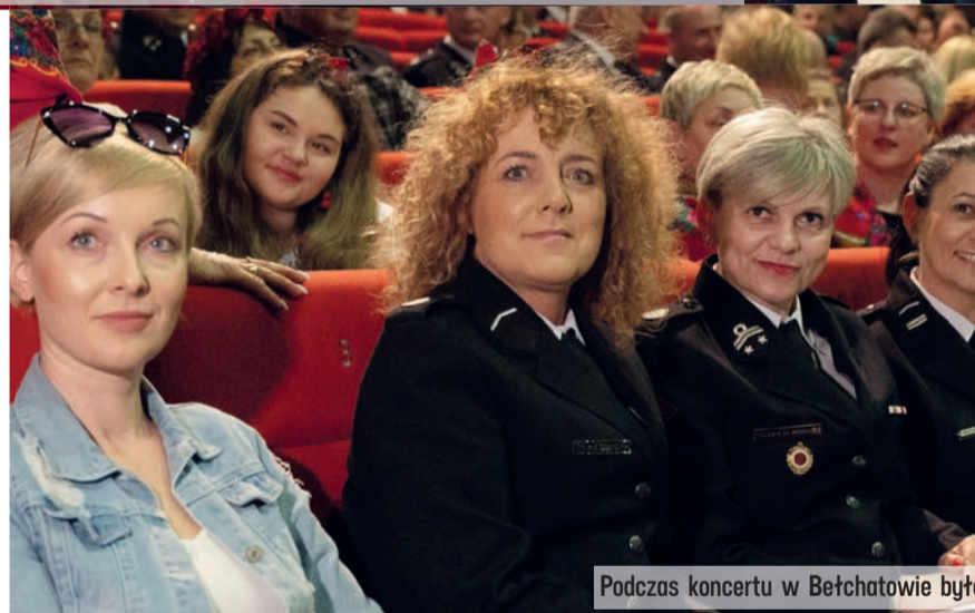
Podczas koncertu w Bełchatowie były