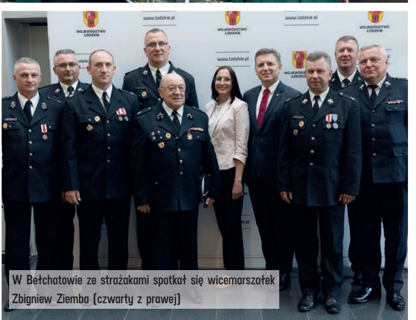
W Bełchatowie ze strażakami spotkał się wicemarszałek Zbigniew Ziemia [czwarty z prawej]