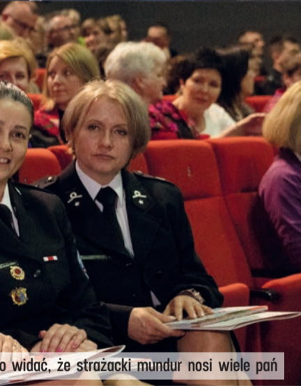
... to widać, że strażacki mundur nosi wiele pań