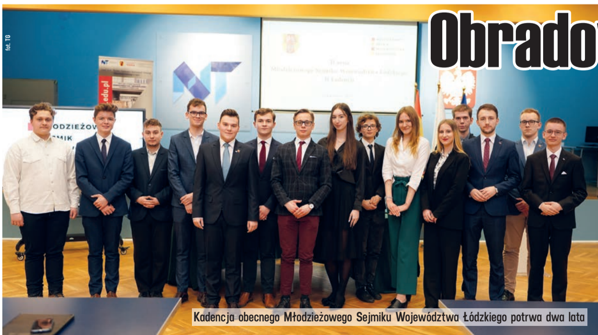
Kadencja obecnego Młodzieżowego Sejmiku Województwa Łódzkiego potrwa dwa lata