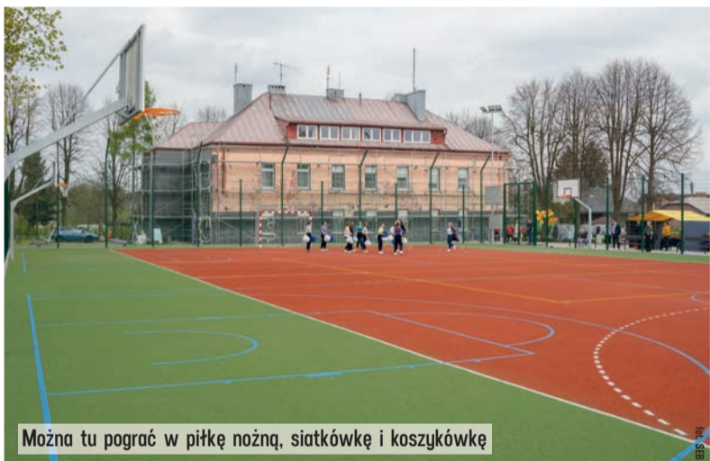
Można tu pograć w piłkę nożną, siatkówkę i koszykówkę