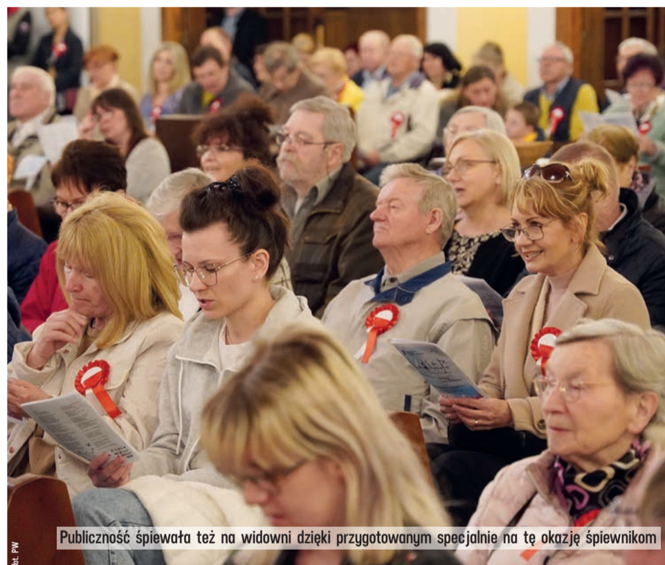
Publiczność śpiewała też na widowni dzięki przygotowanym specjalnie na tę okazję śpiewnikom