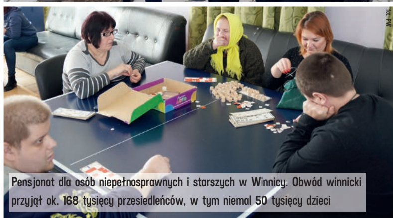
Pensjonat dla osób niepełnosprawnych i starszych w Winnicy. Obwód winnicki przyjął ok. 168 tysięcy przesiedleńców, w tym niemal 50 tysięcy dzieci