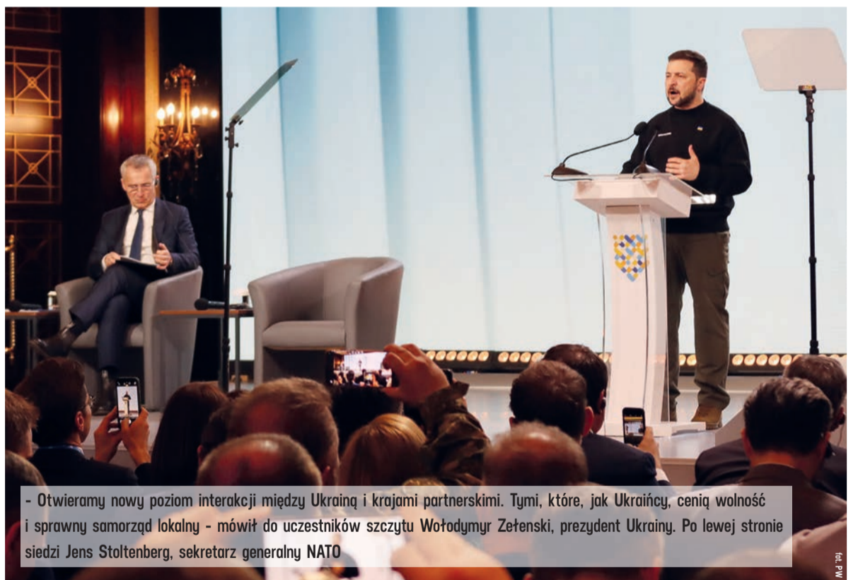
- Otwieramy nowy poziom interakcji między Ukrainą i krajami partnerskimi. Tymi, które, jak Ukraińcy, cenią wolność i sprawny samorząd lokalny - mówił do uczestników szczytu Wołodymyr Zełenski, prezydent Ukrainy. Po lewej stronie siedzi Jens Stoltenberg, sekretarz generalny NATO