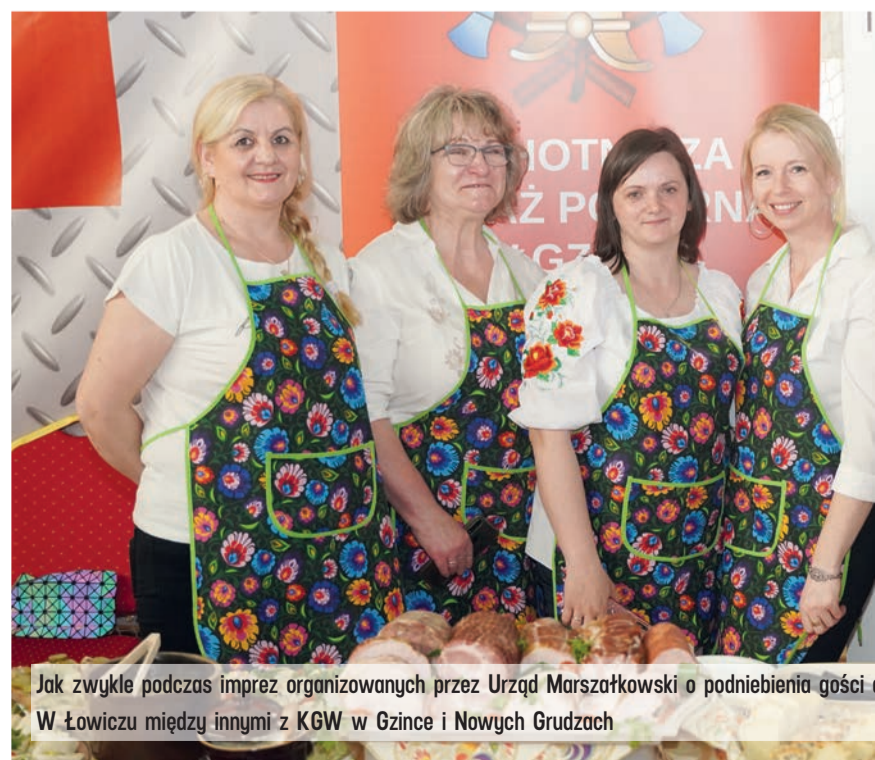
Jak zwykle podczas imprez organizowanych przez Urząd Marszałkowski o podniebienia gości W Łowiczu między innymi z KGW w Gzinie i Nowych Grudzach