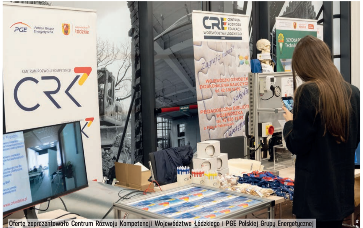
Ofertę zaprezentowało Centrum Rozwoju Kompetencji Województwa Łódzkiego i PGE Polskiej Grupy Energetycznej

Uczniowie mogli zobaczyć, w jaki sposób kształcą się specjalistów automatyki i robotyki czy energetyki odnawialnej. Ale można było też bliżej zapoznać się z zawodem asystenta kierownika produkcji filmowej i telewizyjnej, pszczelarza czy florysty. AK