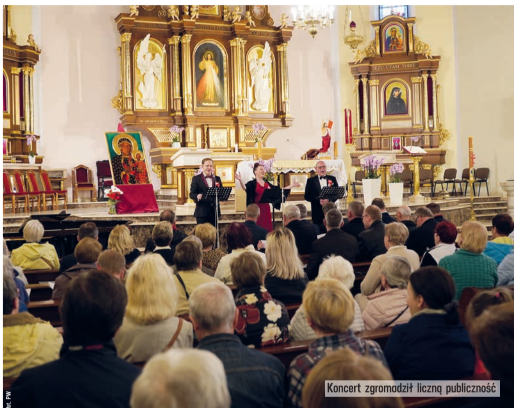
Koncert zgromadził liczną publiczność