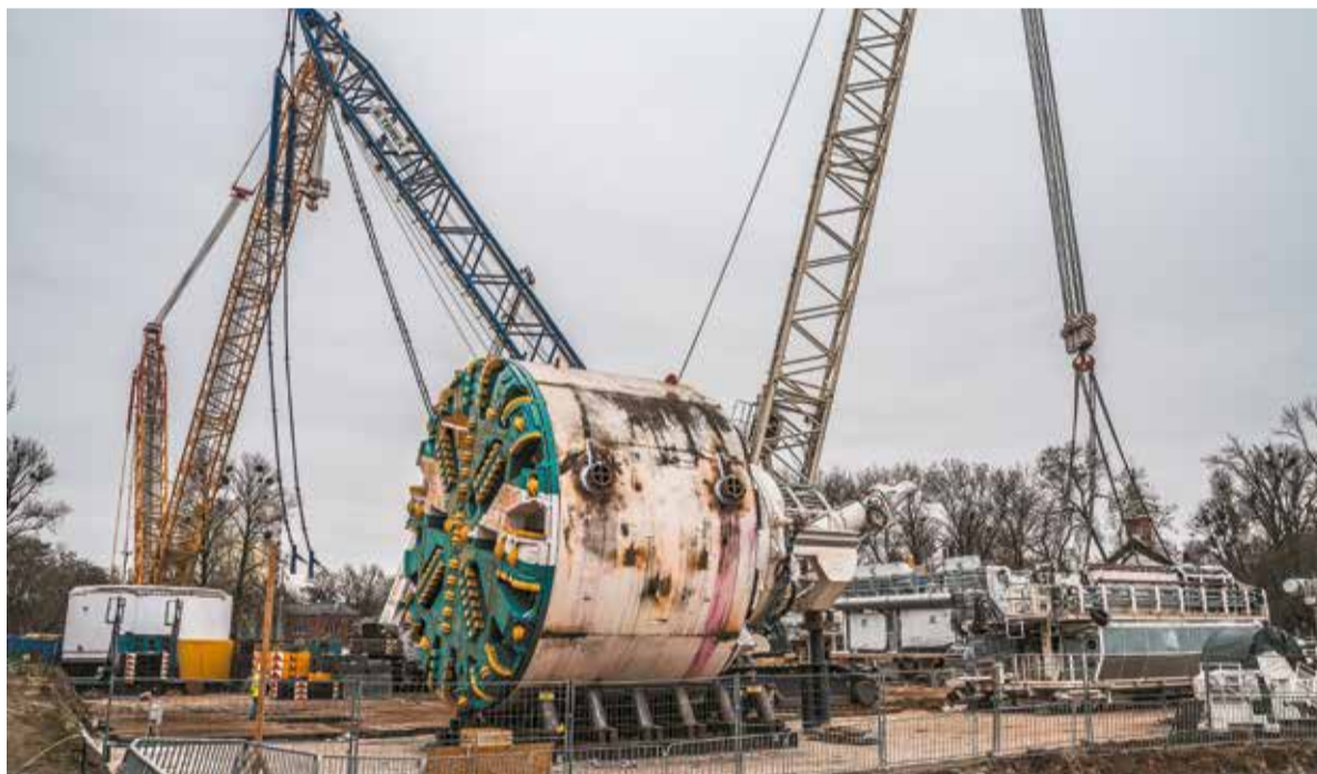
Montaż „Faustyny” przy ul. Długosza. TBM „Faustyna” wybuduje 2 jednotorowe tunele w kierunku Łodzi Kaliskiej i 2 tunele jednotorowe w kierunku Łodzi Żabiańca o łącznej długości 4,5 km i średnicy zewnętrznej 8,5 m

i zacznie pracę w kierunku stacji Łódź Żabieniec. Na tym etapie wydrąży tunel od ul. Włókniarzy do komory przy ul. Skarpowej. Potem zostanie przeniesiona do komory przy ul. Inowrocławskiej i wydrąży tunel do komory przy al. Włókniarzy. Ostatni tunel wydrąży po obróceniu w kierunku stacji Łódź Kaliska. Całkowita długość torów wyniesie ok. 17 km. W najgłębszym miejscu tory w tunelu będą przebiegać ok. 26 metrów pod powierzchnią ziemi, tj. ok. 9 pięter budynku mieszkalnego.