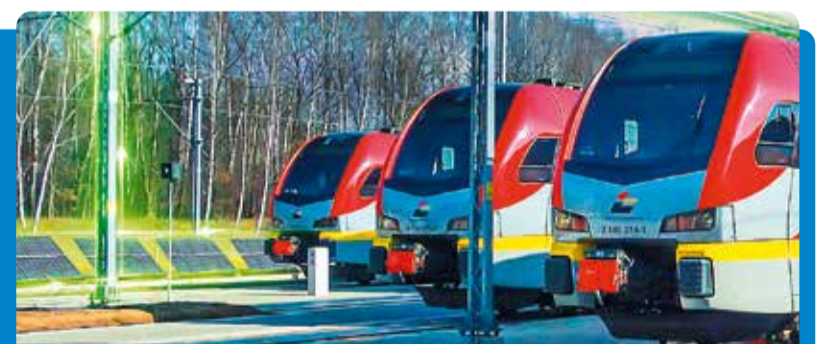
Łódzka Kolej Aglomeracyjna jest pierwszym przewoźnikiem pasażerskim, który zadeklarował aktywne dołączenie do procesu transformacji energetycznej kolei

– Udział Łódzkiej Kolei Aglomeracyjnej w programie Zielona Kolej świetnie wpisuje się w Strategię Rozwoju Województwa Łódzkiego 2030. I to w dwa istotne cele na najbliższe