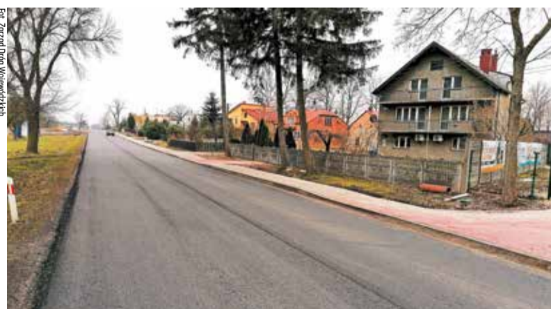
Mieszkańcy Próby po przebudowie drogi wojewódzkiej nr 482 cieszą się z szerokiego chodnika