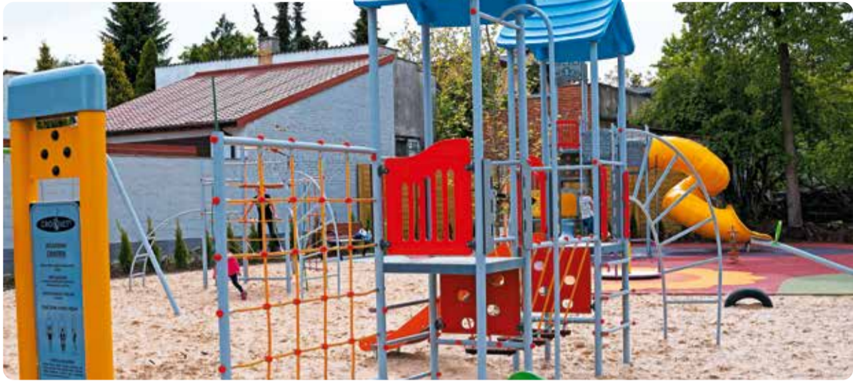
Plac zabaw w gminie Burzenin zbudowany z dotacją z poprzedniej edycji programu „Infrastruktura sportowa PLUS”

75 samorządów z naszego województwa otrzyma dotacje na budowę lub modernizację boisk, siłowni, placów zabaw. To pieniądze z programu Urzędu Marszałkowskiego „Infrastruktura sportowa PLUS”.