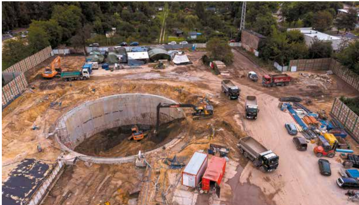
Budowa wejścia pod TMB „Katarzyna” przy ul. Stolarskiej

„Faustyna” drąży tunel z komory przy ul. Długosza i al. Włókniarzy w kierunku komory zachodniej przy ul. Stolarskiej i Odolanowskiej. Następnie maszyna zostanie obrócona