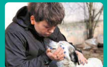
Jedna z nagrodzonych fotografii nadesłanych przez Łódzkie Towarzystwo Opieki nad Zwierzętami