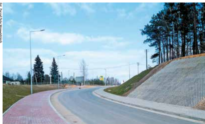
Wyremontowana droga wojewódzka nr 726 łącząca zagłębie ceramiczne w Opocznie z wjazdem na drogę ekspresową S8 w Rawie Mazowieckiej