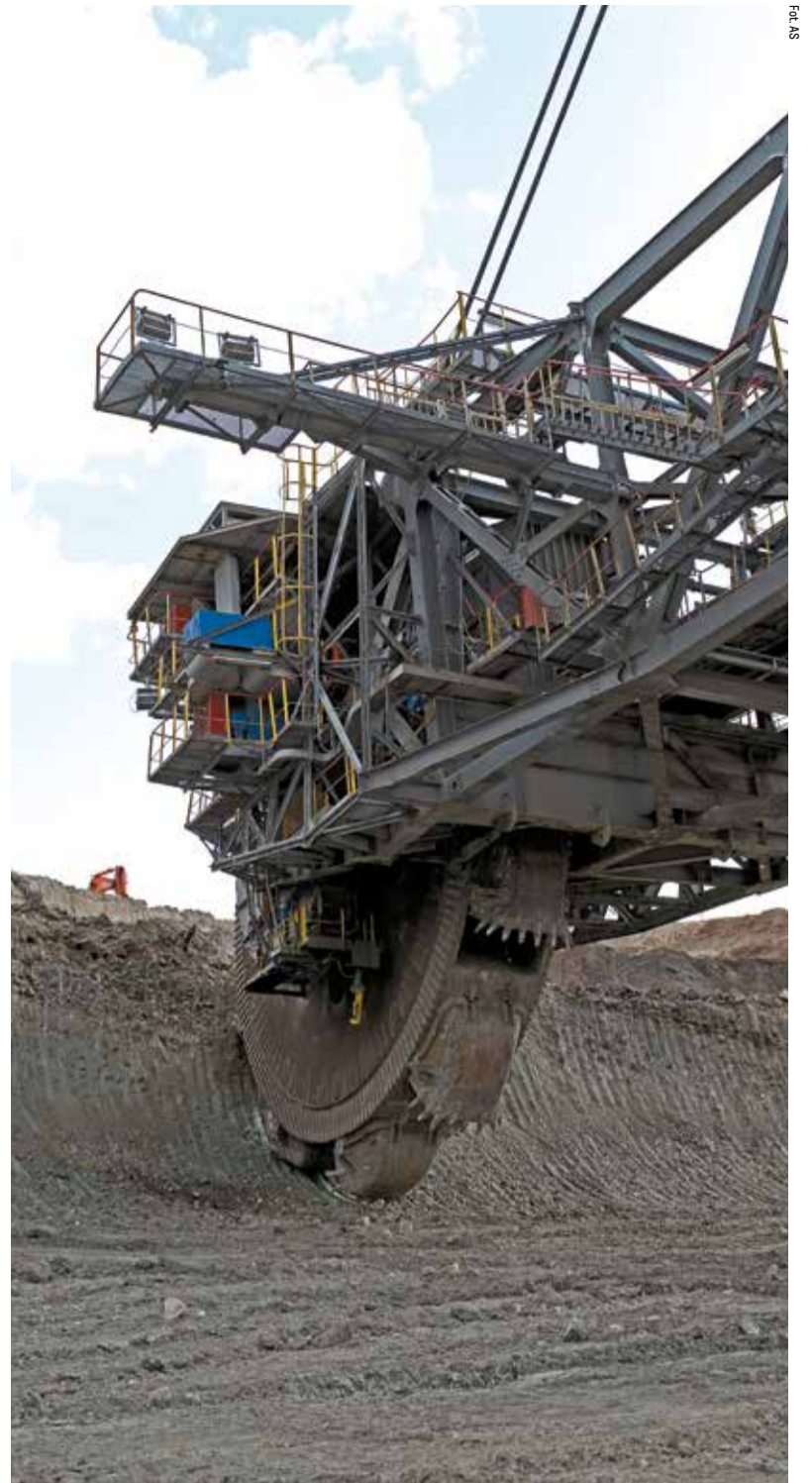
Plan został przyjęty, aby okręg bełchatowski mógł liczyć na dodatkowe pieniądze unijne w związku z przewidywanym zakończeniem wydobycia węgla brunatnego

W trakcie konsultacji odbyły się, między innymi, spotkania z przedstawicielami jednostek samorządu terytorialnego oraz organizacji pozarządowych. Plan był też omawiany w trakcie posiedzenia zespołu ds. transformacji obszarów górniczych województwa łódzkiego. W terminie przewidzianym na konsultacje złożone zostały 163 wnioski i uwagi do projektu planu. Wszystkie zostały poddane szczegółowej analizie, której wynikiem jest „Raport z przeprowadzenia konsultacji społecznych”. Projekt planu wraz z raportem został przyjęty przez zarząd województwa na posiedzeniu 29 czer-