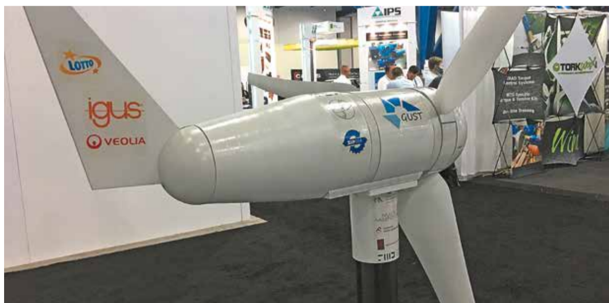
Średnica przydomowej turbiny wynosi jedynie 1,6 m, a wysokość konstrukcji niecałe 2 m. Obecnie urządzenie generuje moc 460 watów

Wprawdzie dzieło myśli twórczej młodych naukowców z Łodzi nie zapewni samowystarczalności energetycznej, ale pomoże w pozyskiwaniu energii ze źródeł odnawialnych, jeśli dom będzie zasilany także za pomocą paneli fotowoltaicznych. Obecnie urządzenie generuje moc 460 watów, co w praktyce oznacza, że poradzi sobie na przykład z ogrzaniem wody na potrzeby gospodarstwa domowego.