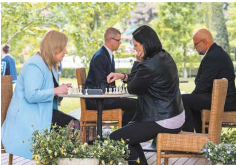
W turnieju szachowym, który był zwieńczeniem pierwszego etapu projektu, rywalizowali nauczyciele biorący udział w kursach