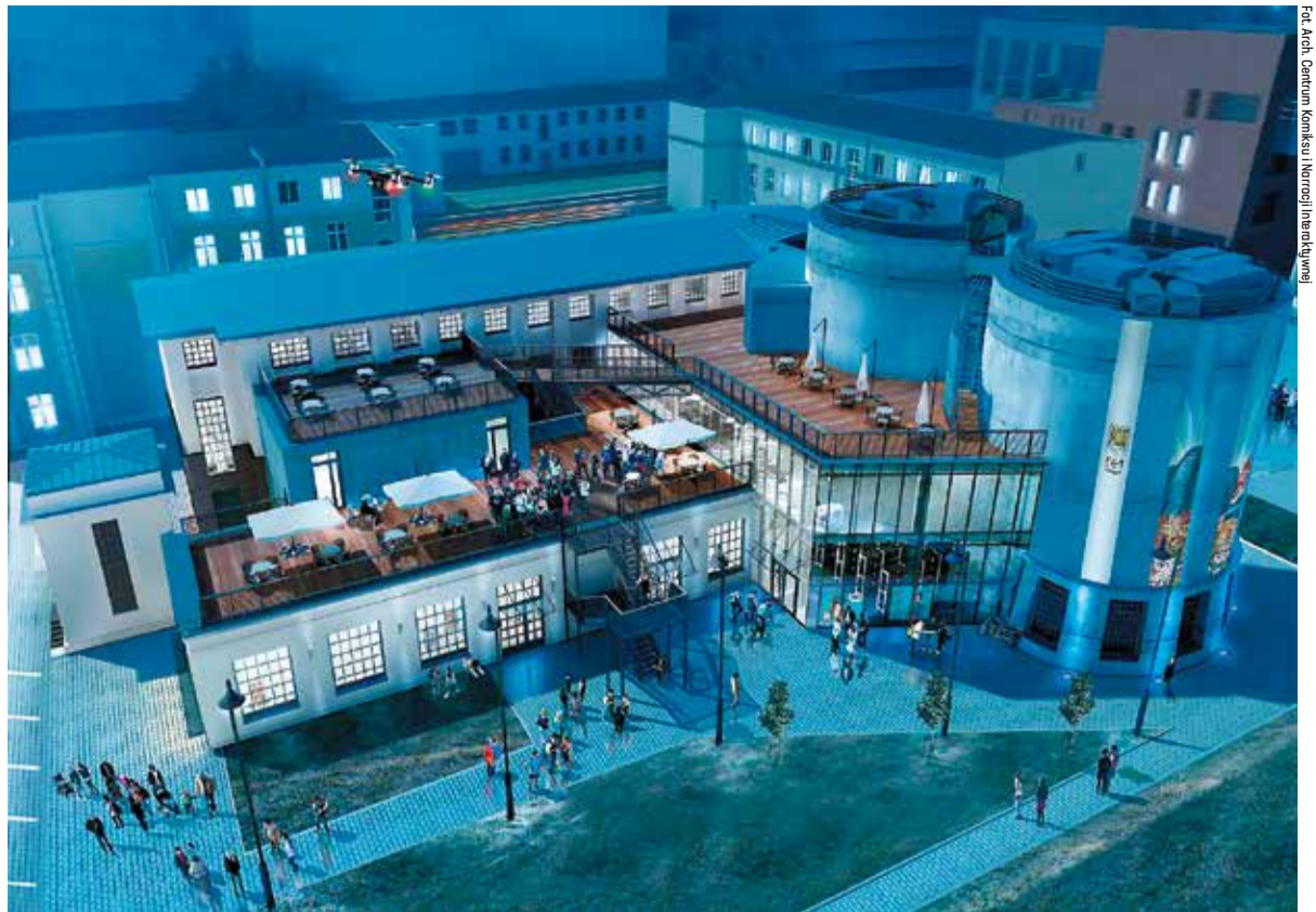
Centrum Komiksu i Narracji Interaktywnej będzie się mieścić w trzykondygnacyjnym budynku

Warto przypomnieć, że to już kolejne pieniądze przyznane Łodzi na duże, kluczowe inwestycje. Pod koniec marca marszałek zatwierdził wsparcie finansowe rewitalizacji Księży Młyna. ■