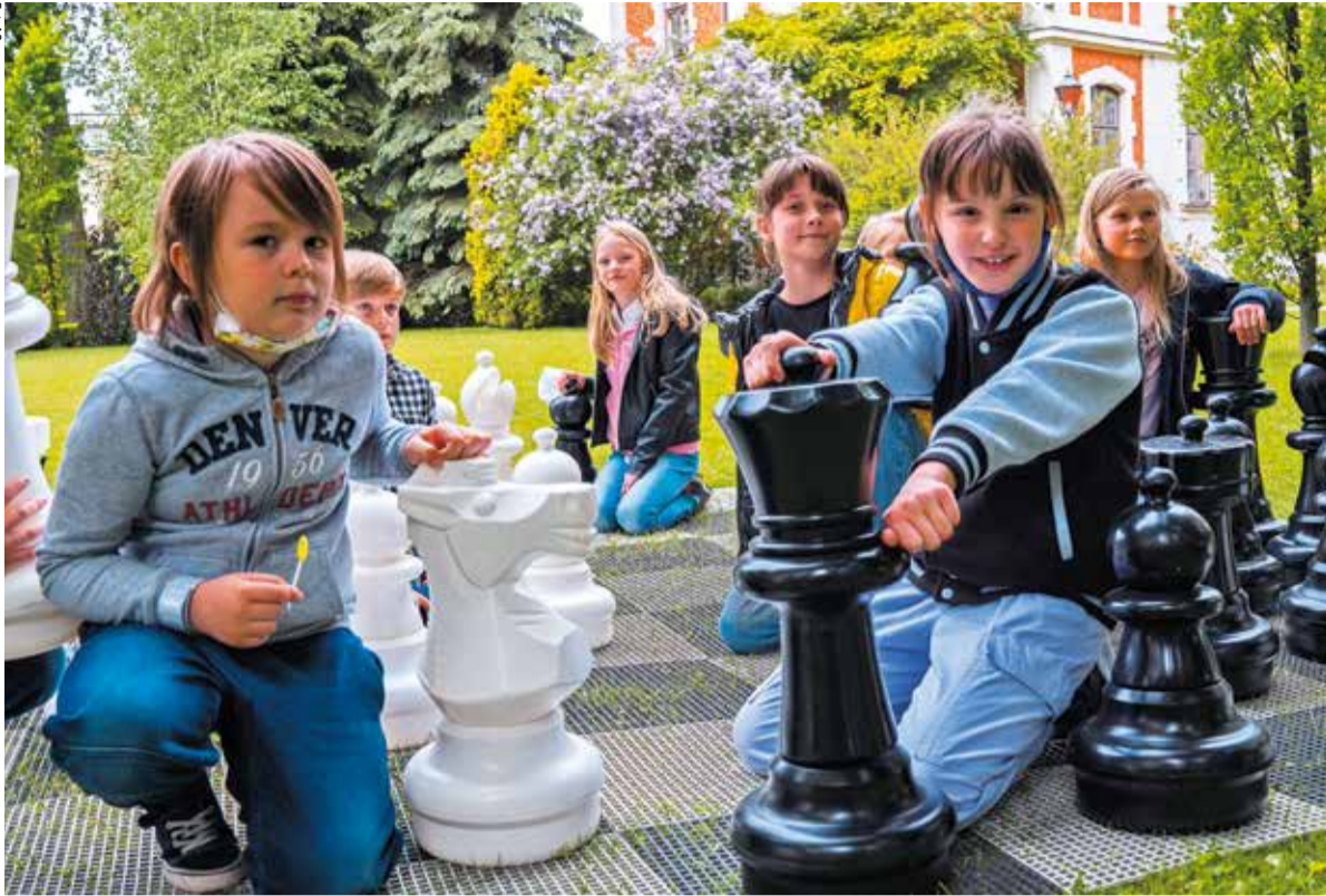
Dzieci ze szkół, które biorą udział w projekcie, zagrały w szachy ogrodowe