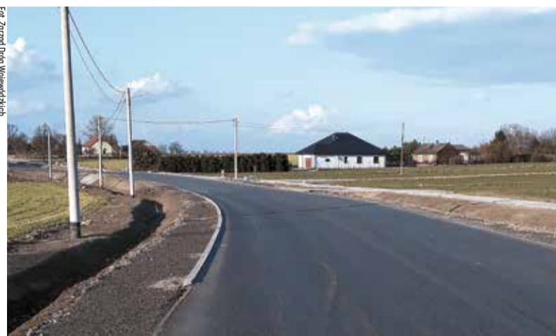
Droga biegnąca przez gminę Sulmierzyce po remoncie