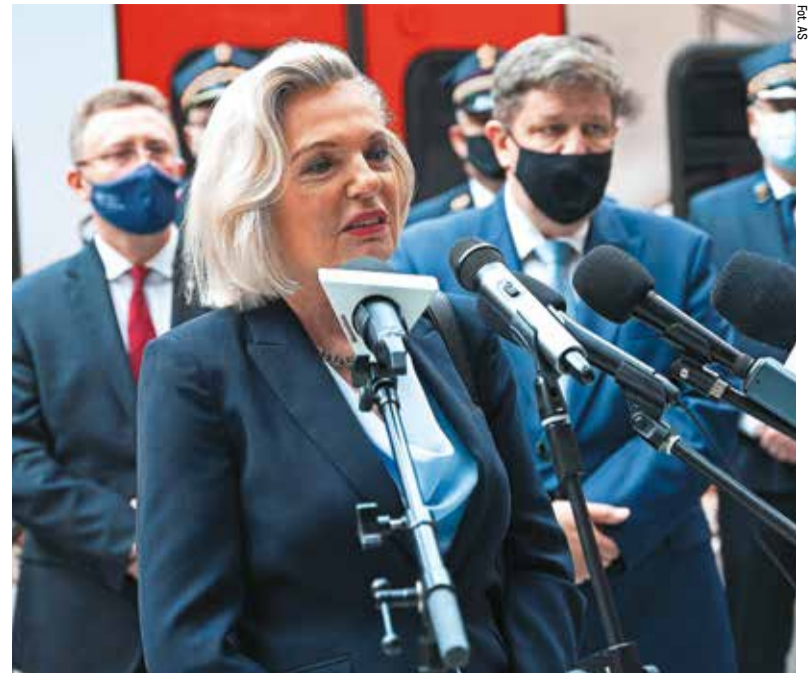
Gościem honorowym uroczystości była Anna Maria Anders, ambasador RP we Włoszech, córka generała Andersa

W tym roku przypada 80. rocznica powstania Armii Polskiej w Związku Sowieckim pod dowództwem gen. Władysława Andersa. To dzięki jego determinacji było możliwe stworzenie armii, wyszkolenie jej i przygotowanie do działań u boku