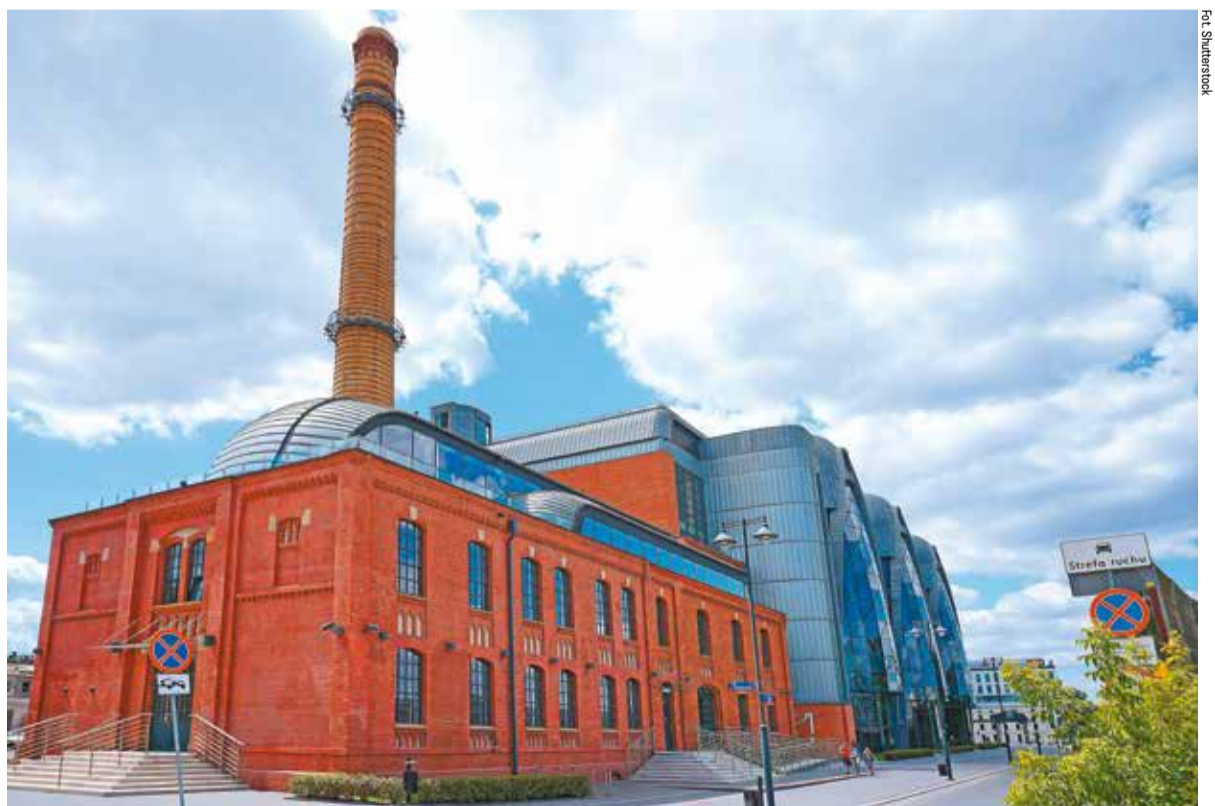
Obie instytucje są współprowadzone przez Ministerstwo Kultury, Dziedzictwa Narodowego i Sportu. Powstają w kompleksie EC1