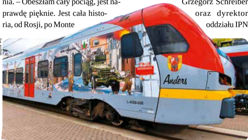
Grafika na pociągu przedstawia szlak bojowy 2. Korpusu Polskiego