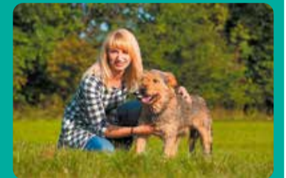
Jedna z nagrodzonych fotografii nadesłanych przez Łódzkie Towarzystwo Opieki nad Zwierzętami