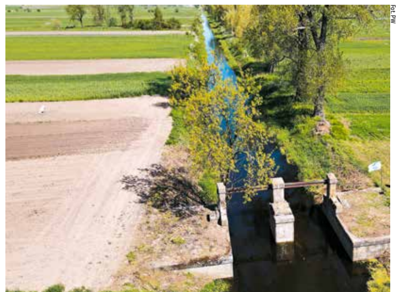
Jaz w miejscowości Złaków Borowy nie był remontowany od 1945 roku