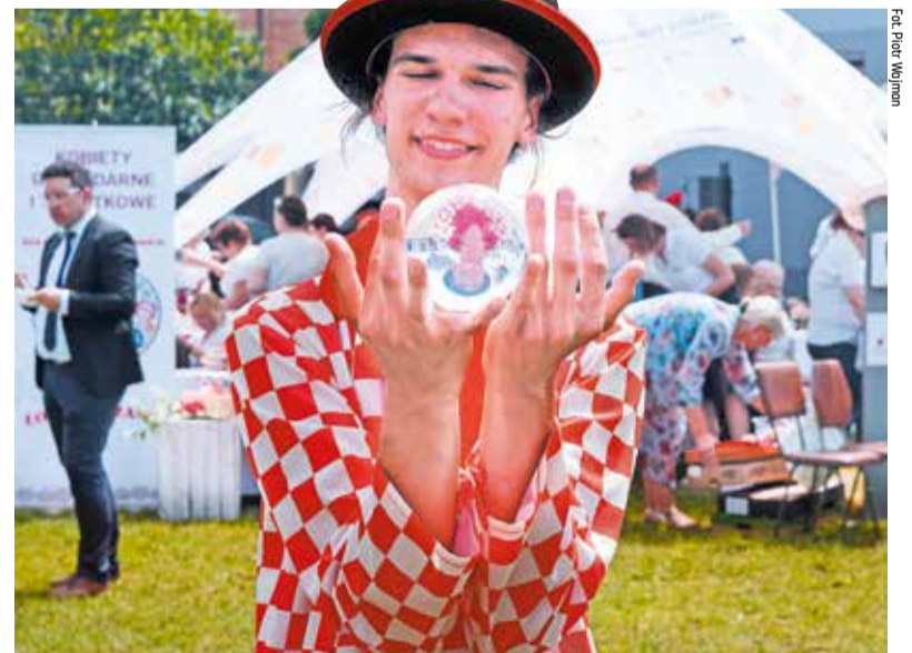
Pikniki potrwać jeszcze w sierpniu i we wrześniu

Popołudniami mieszkańcy bawią się na piknikach rodzinnych. Na straganach można dowiedzieć się wszystkiego o funduszach unijnych, ofercie Urzędu Marszałkowskiego i podległych mu teatrów, domu kultury, filharmonii, czy Wytwórni