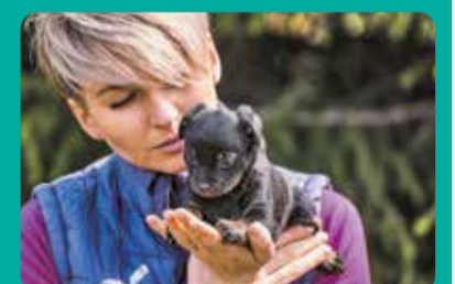
Nagrodzone zdjęcie nadesłane przez Stowarzyszenie Animal SOS z Aleksandrowa Łódzkiego