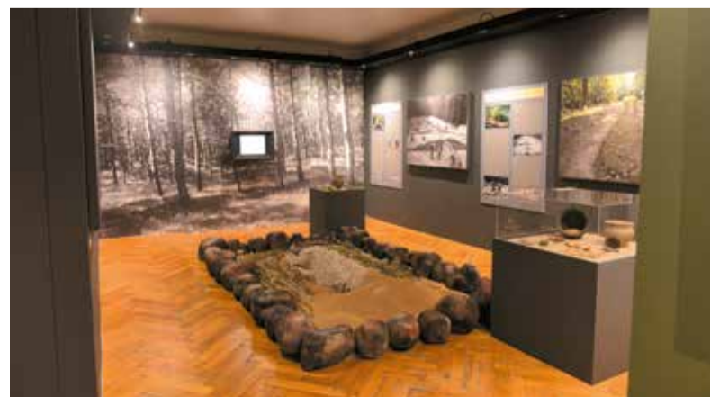
Na wystawie można zobaczyć także repliki kurhanów