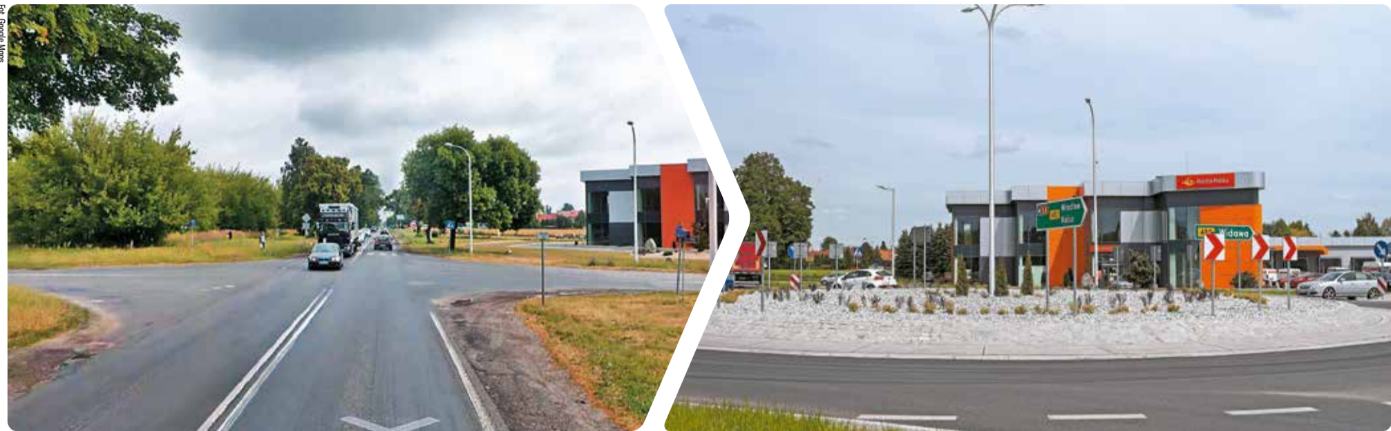
Skrzyżowanie ulic 1 Maja i Jana Pawła II, czyli dróg wojewódzkich 480 i 482 w Sieradzu przed i po remoncie

Dobiega końca część dużych remontów realizowanych przez Zarząd Dróg Wojewódzkich. Niektóre już się zakończyły, i to przed czasem.