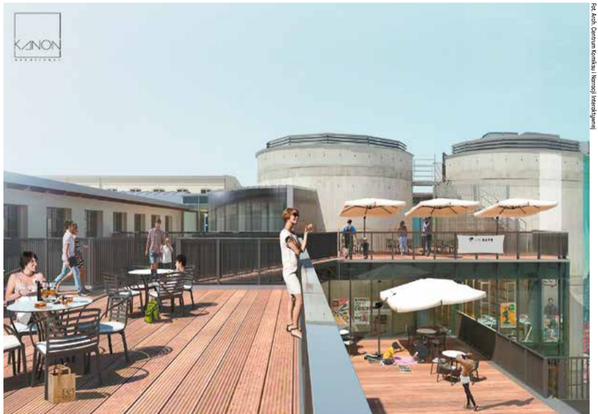
Po obejrzeniu wystaw będzie można wypić kawę i podelektować się pięknym widokiem