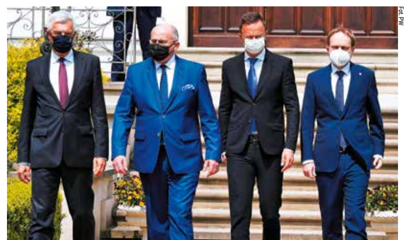
Gospodarzem spotkania był Zbigniew Rau, minister spraw zagranicznych (drugi z lewej)