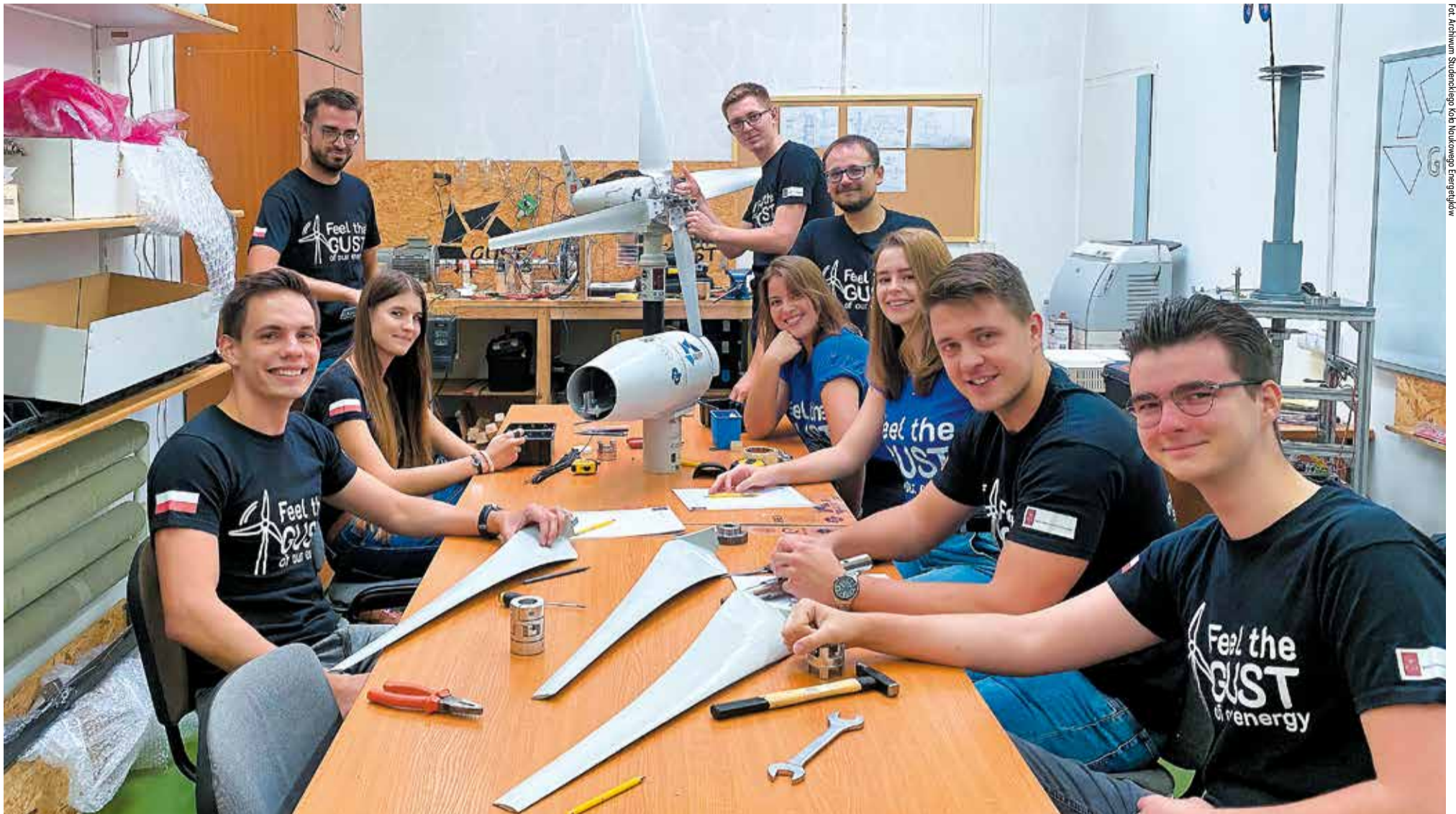
Studenckie Koło Naukowe Energetyków przy Instytucie Maszyn Przepływowych Wydziału Mechanicznego Politechniki Łódzkiej