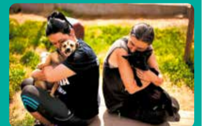
Nagrodzone zdjęcie nadesłane przez Towarzystwo Przyjaciół Zwierząt „ARKADIA” z Głowna